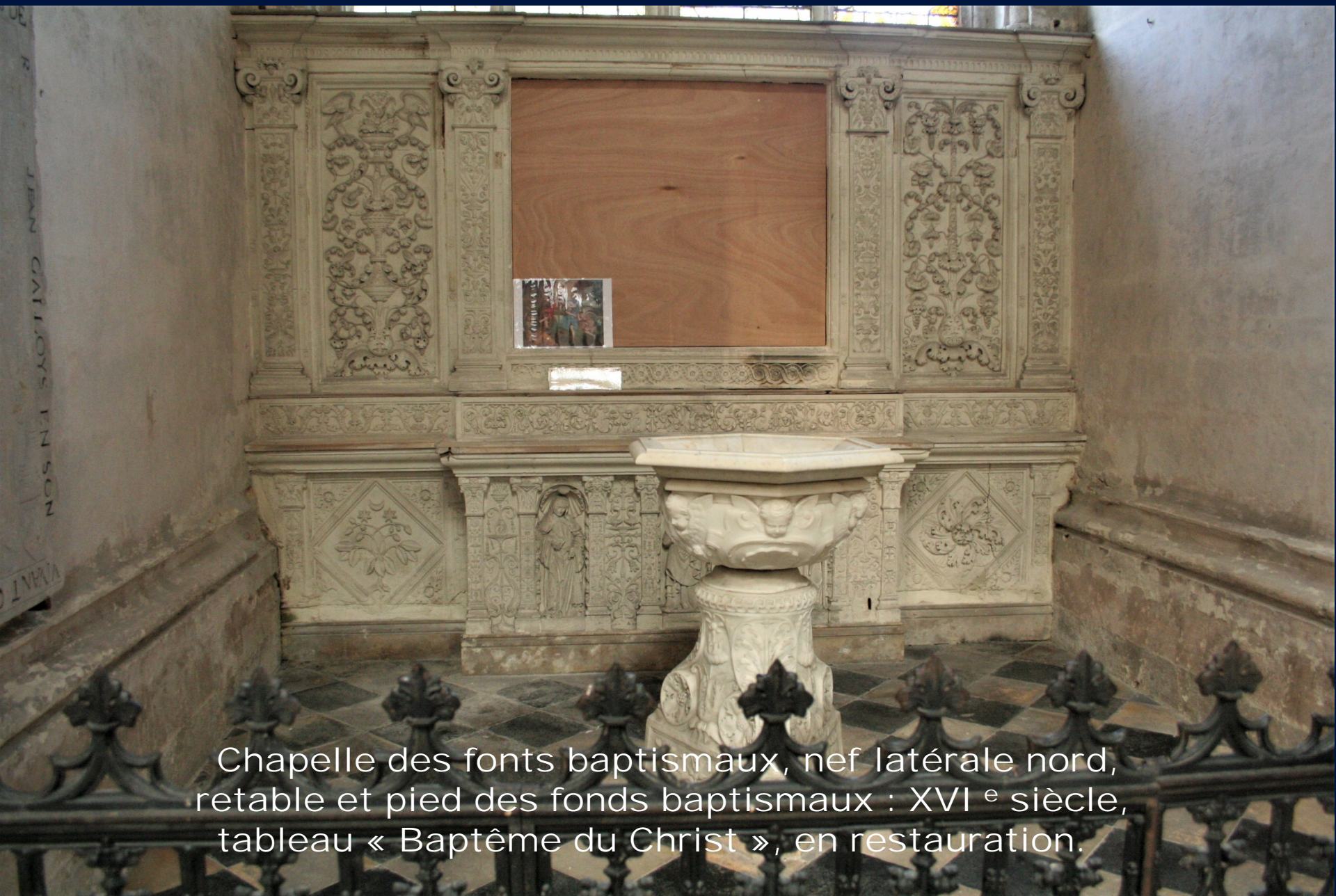
Chapelle des fonts baptismaux, nef latérale nord, retable et pied des fonds baptismaux : XVI e siècle, tableau « Baptême du Christ », en restauration.