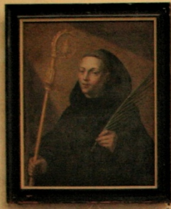
Saint Florentine abbaye de la Madeleine de la Roche