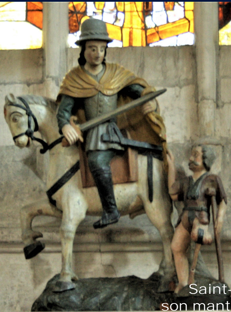
Saint-Martin partageant son manteau avec un mendiant, bois polychrome, XVI e siècle.