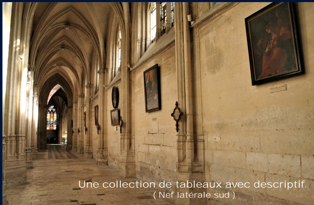
Une collection de tableaux avec descriptif. ( Nef latérale sud )