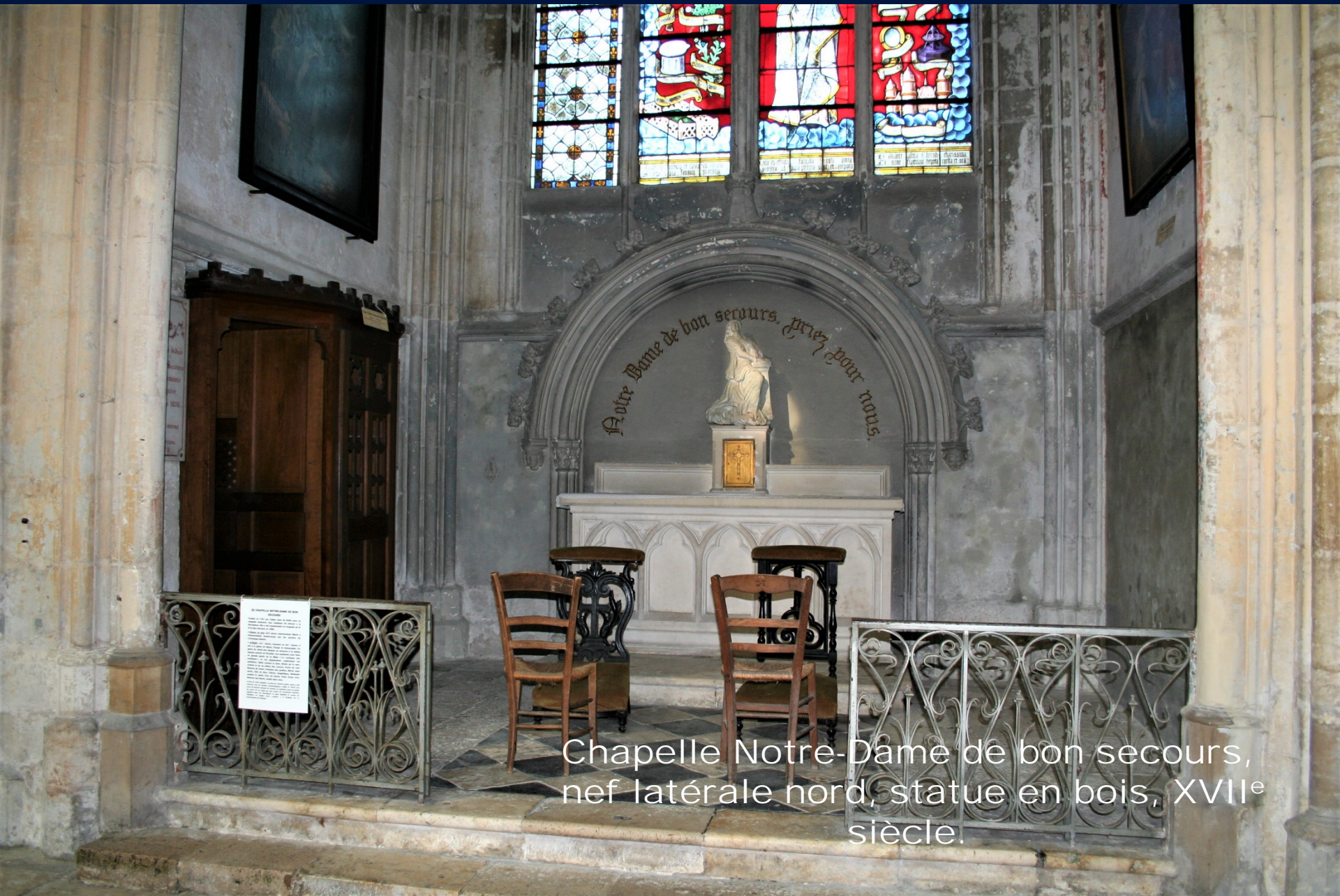
Chapelle Notre-Dame de bon secours, nef latérale nord, statue en bois, XVII e siècle.