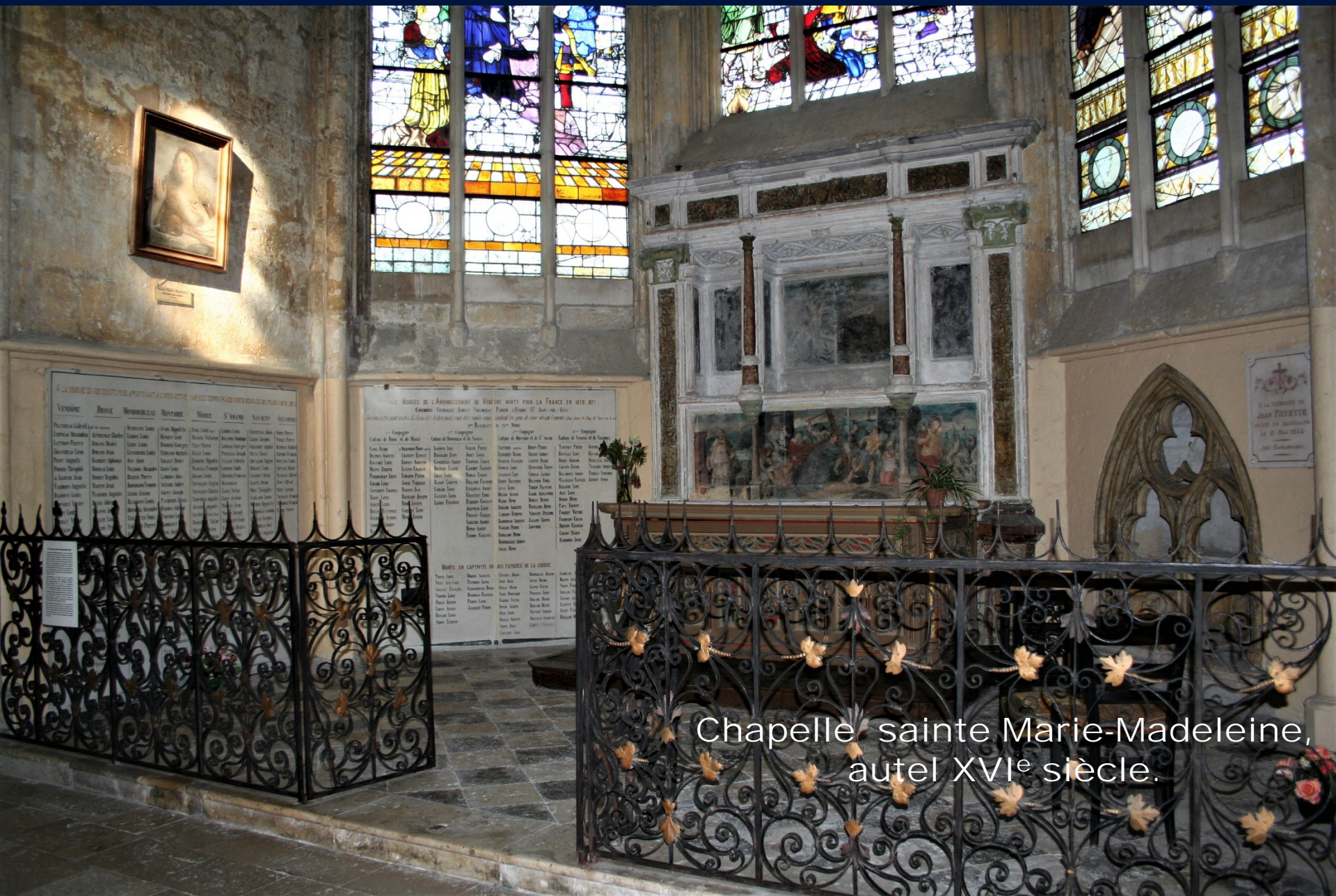
Chapelle sainte Marie-Madeleine, autel XVI e siècle.