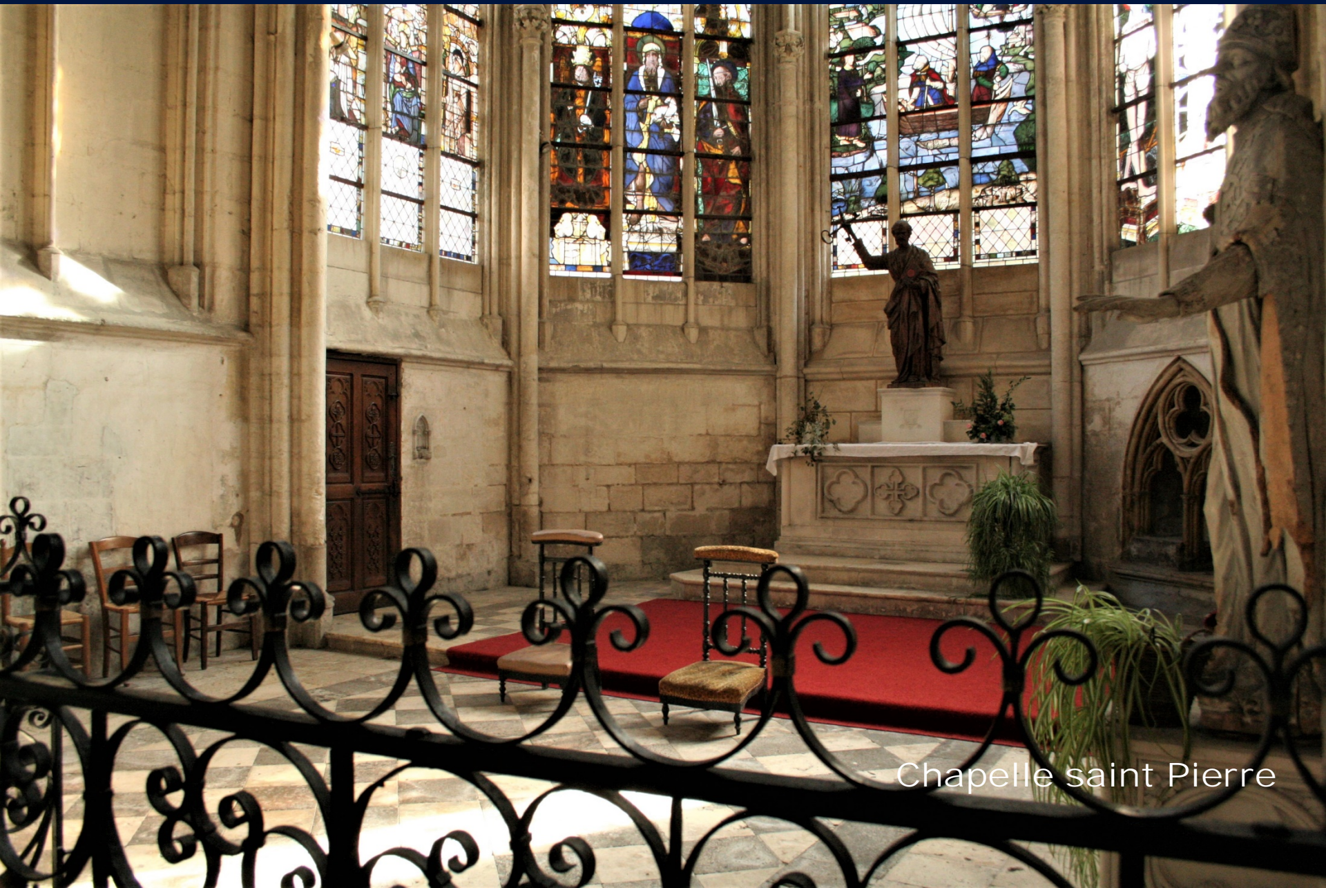
Chapelle saint Pierre