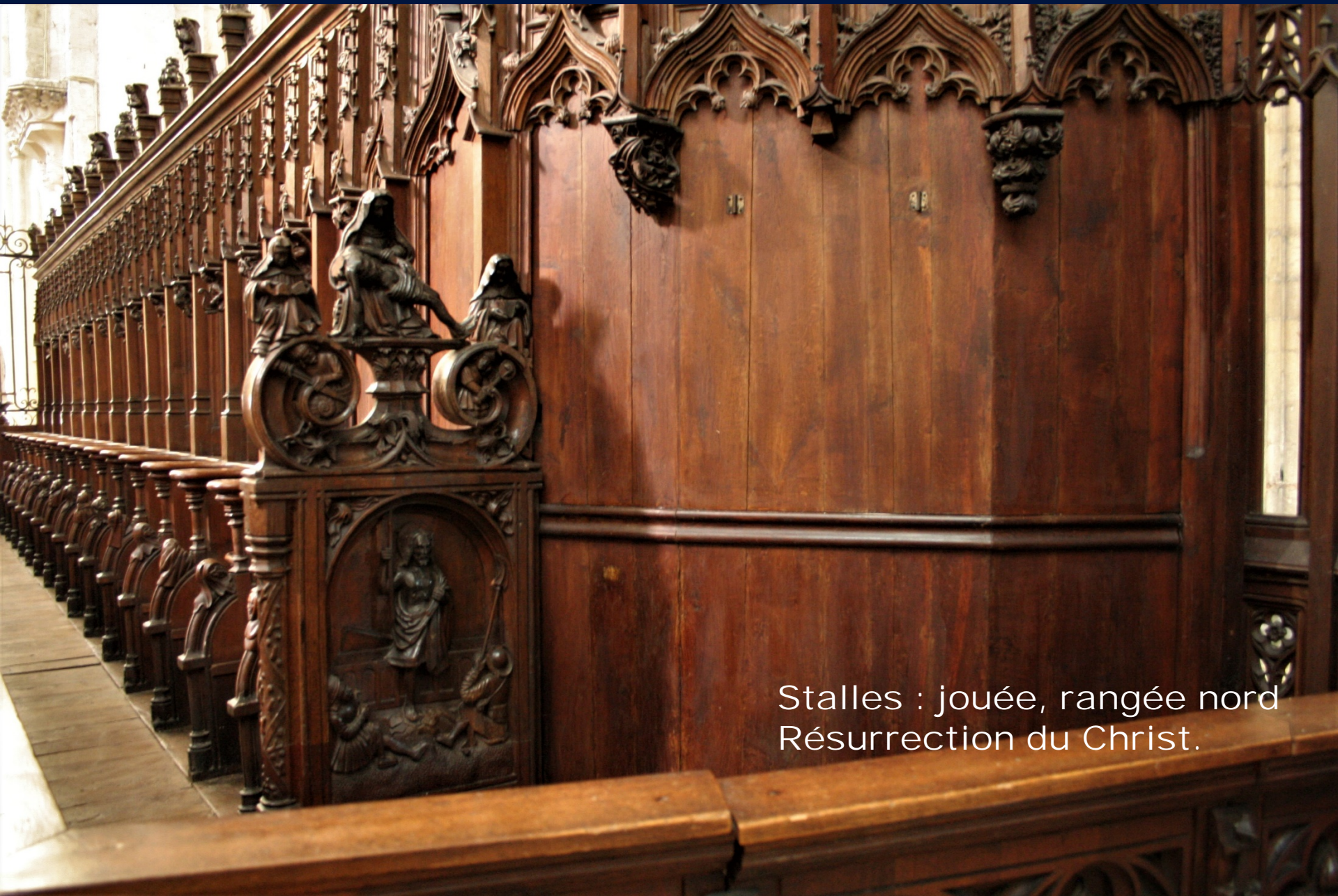
Stalles : jouée, rangée nord Résurrection du Christ.