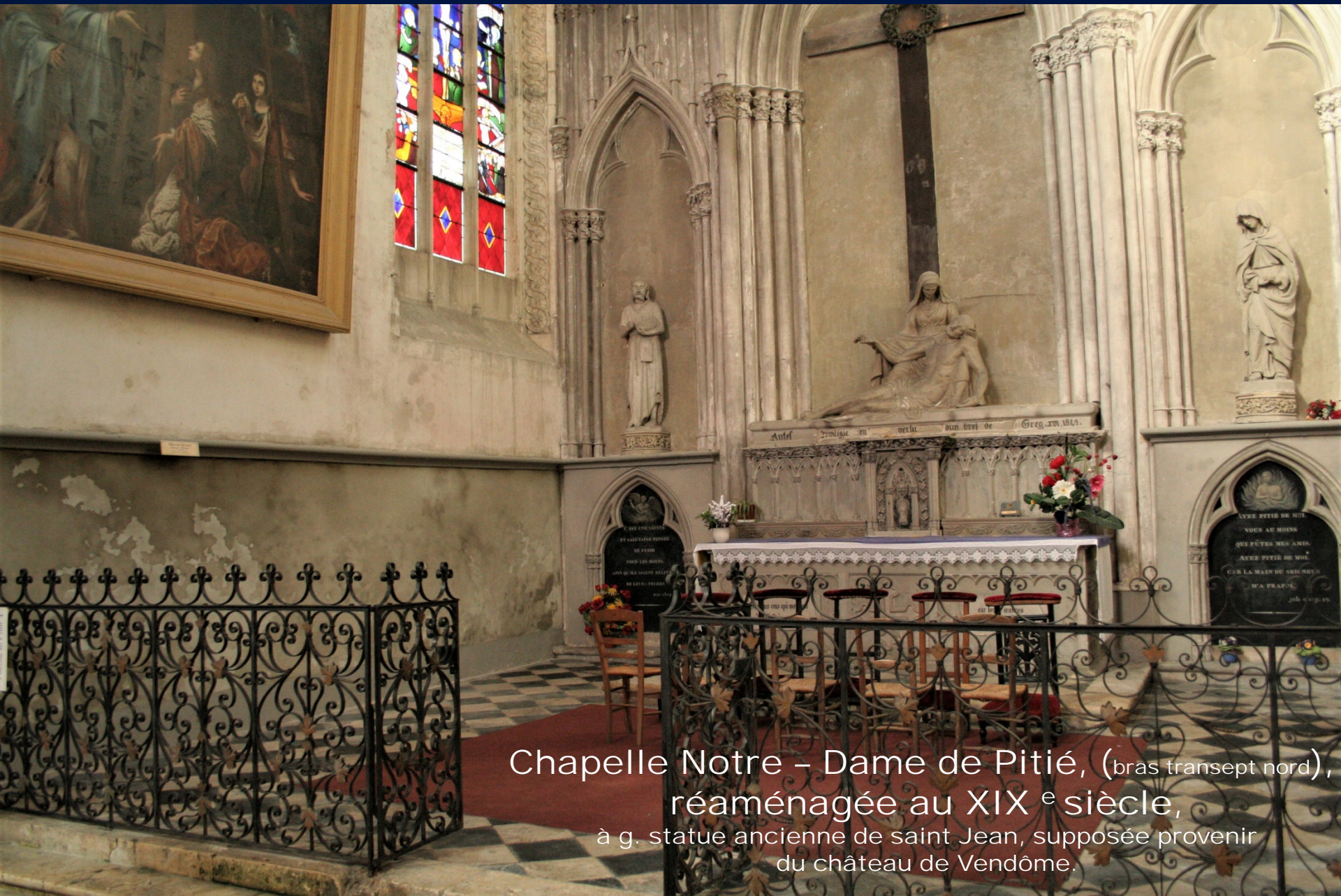
Chapelle Notre - Dame de Pitié, (bras transept nord), réaménagée au XIX e siècle, à g. statue ancienne de saint Jean, supposée provenir du château de Vendôme.