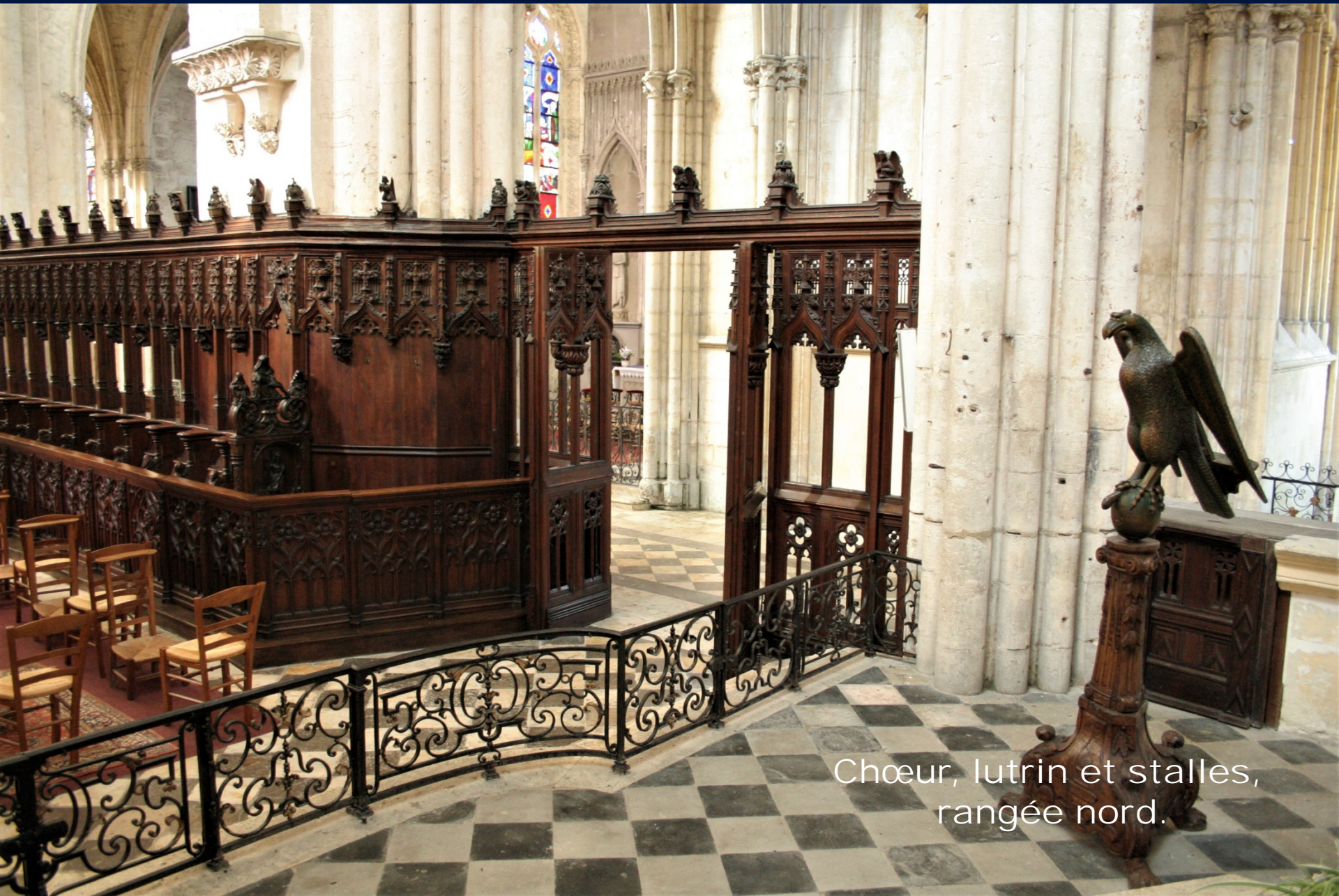
Chœur, lutrin et stalles, rangée nord.