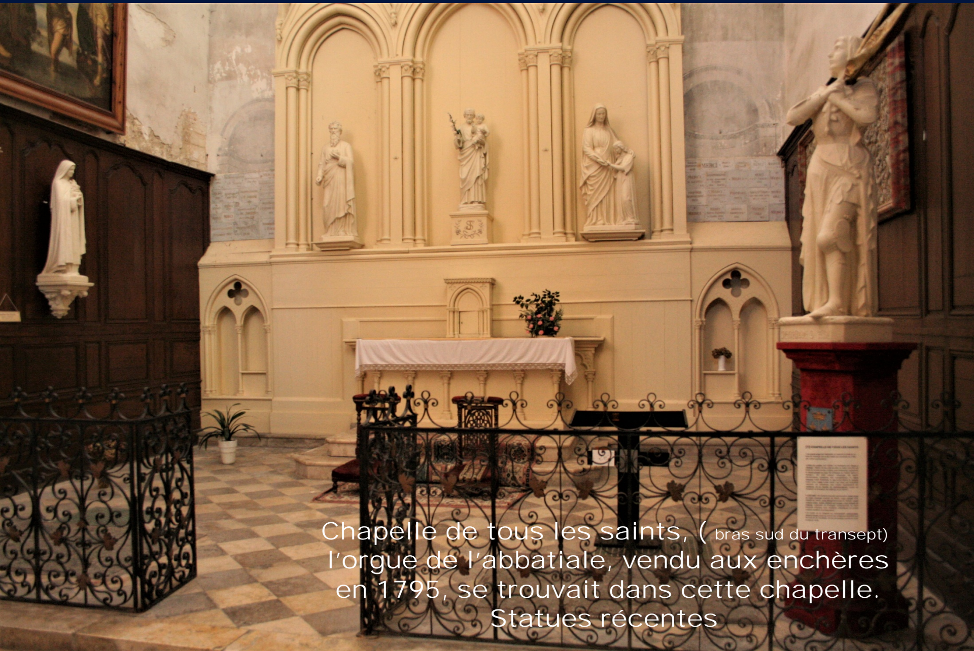
Chapelle de tous les saints, ( bras sud du transept) l'orgue de l'abbatiale, vendu aux enchères en 1795, se trouvait dans cette chapelle. Statues récentes