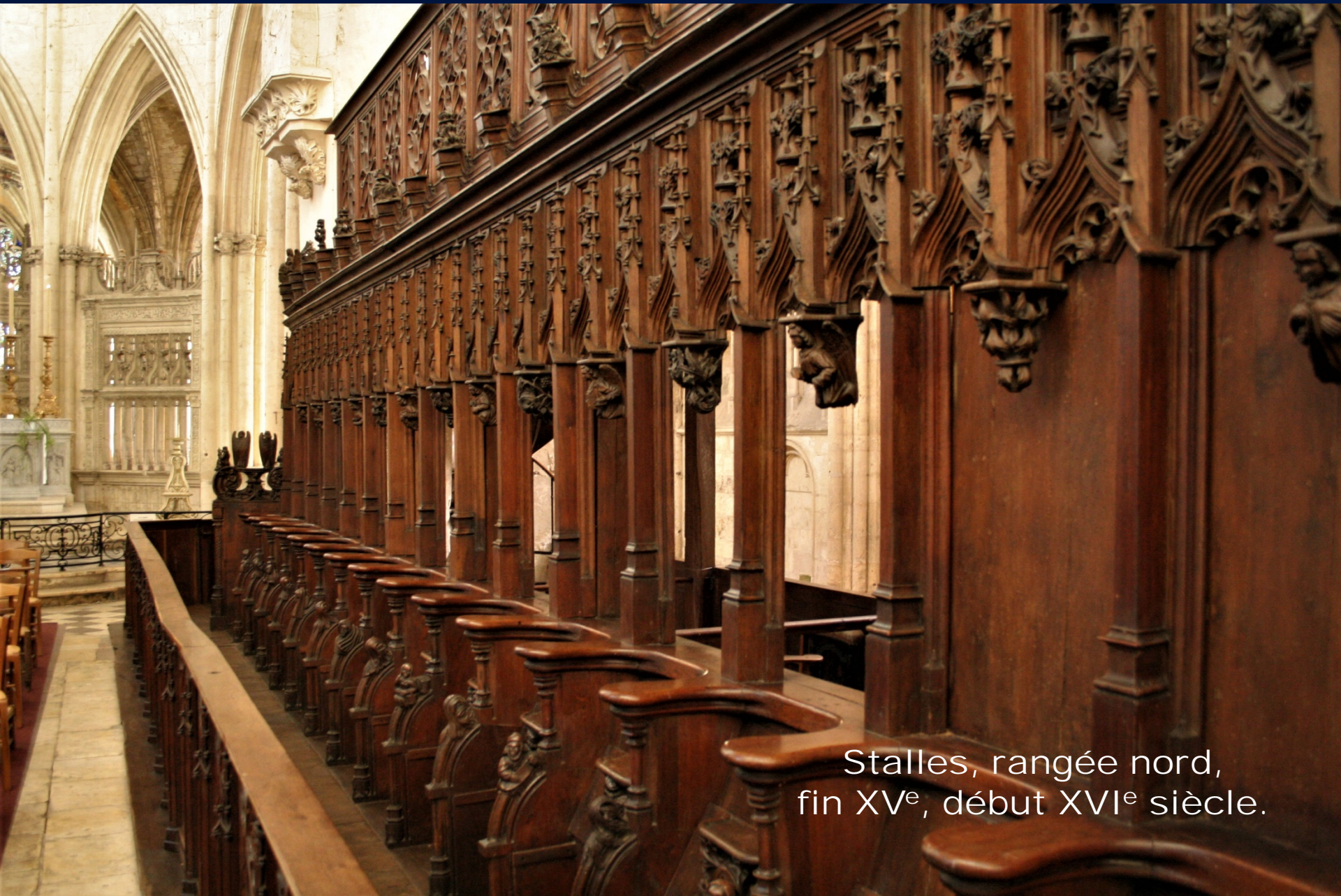
Stalles, rangée nord, fin XV e , début XVI e siècle.