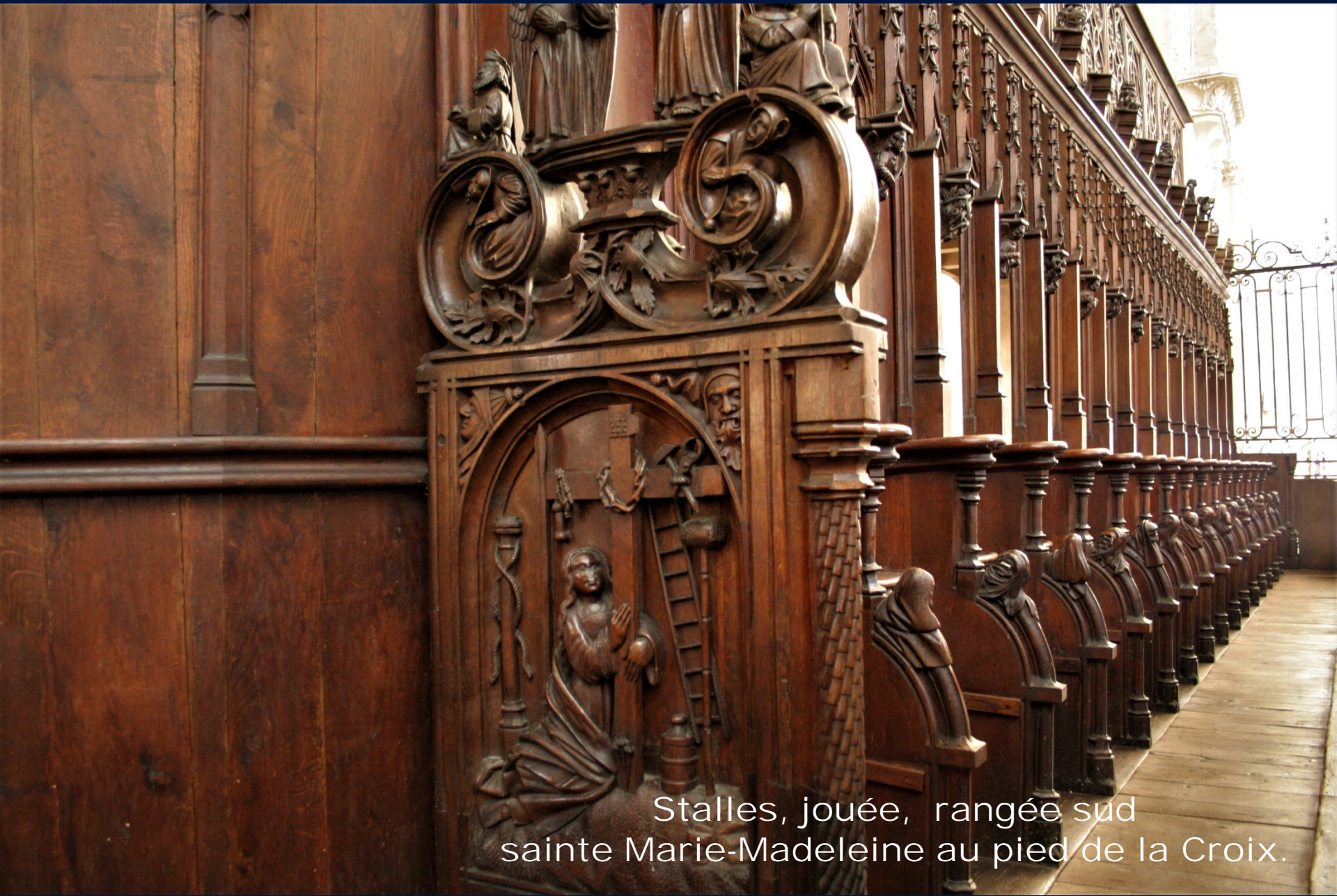
Stalles, jouée, rangée sud sainte Marie-Madeleine au pied de la Croix.