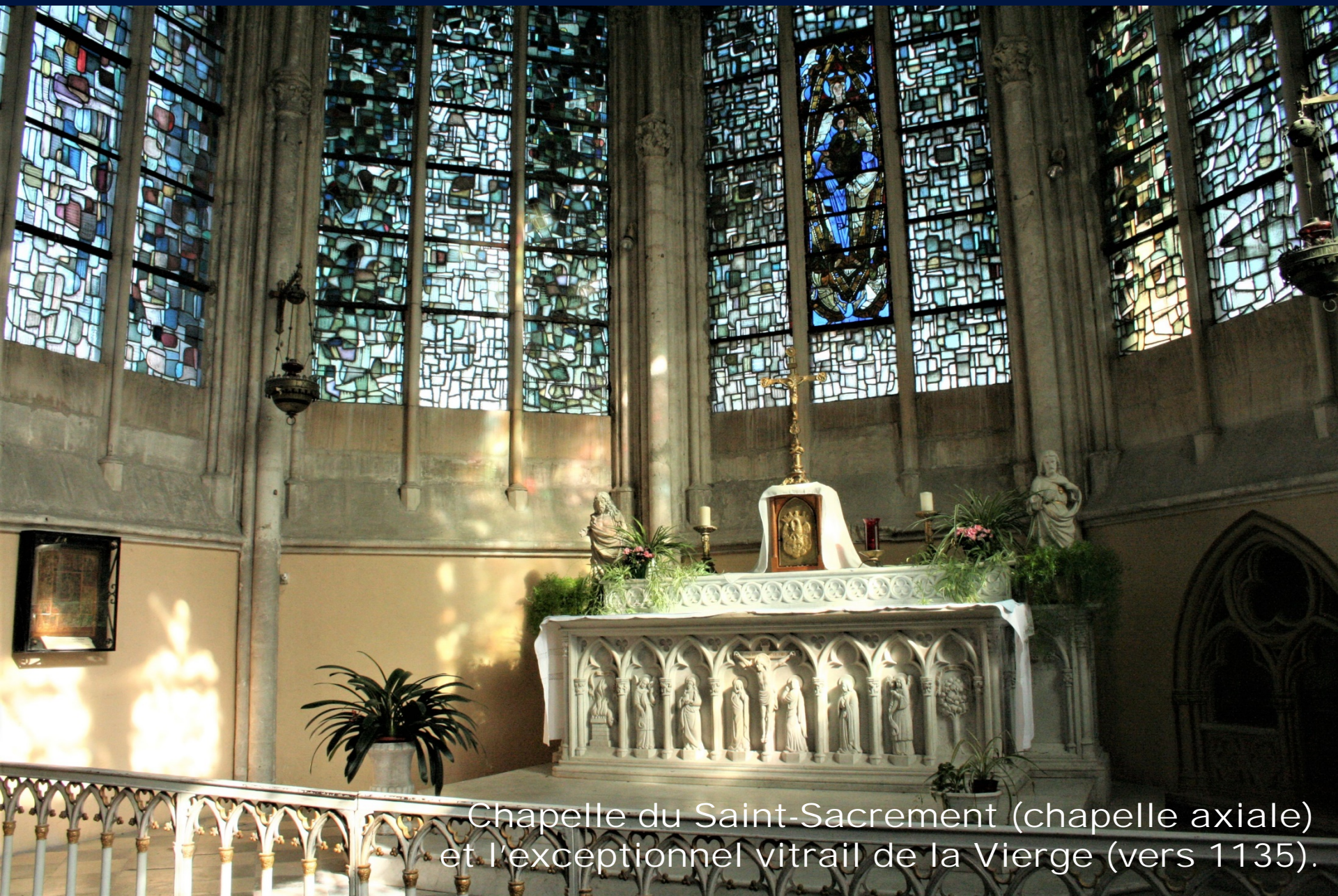
Chapelle du Saint-Sacrement (chapelle axiale) et l'exceptionnel vitrail de la Vierge (vers 1135).