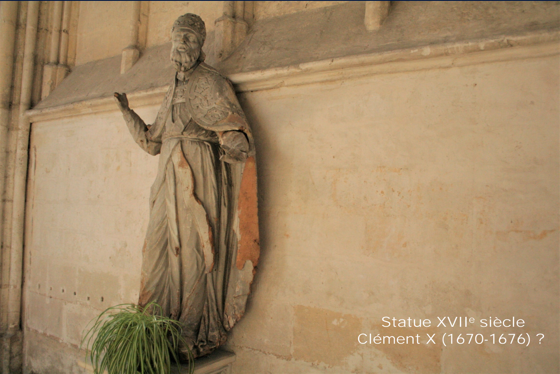
Statue XVII e siècle Clément X (1670-1676) ?