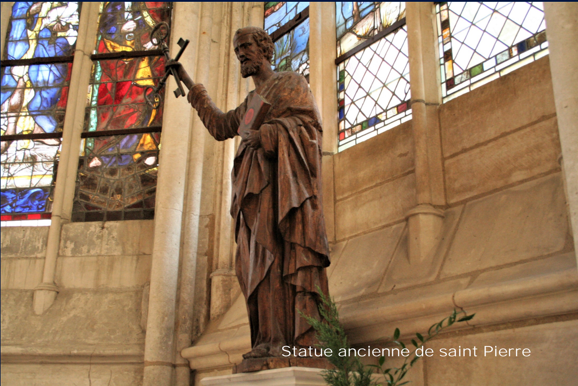
Statue ancienne de saint Pierre