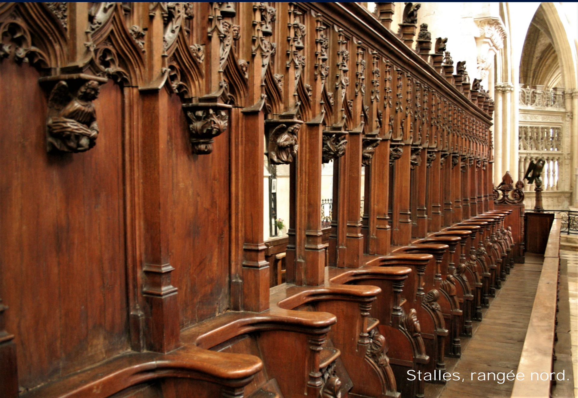
Stalles, rangée nord.