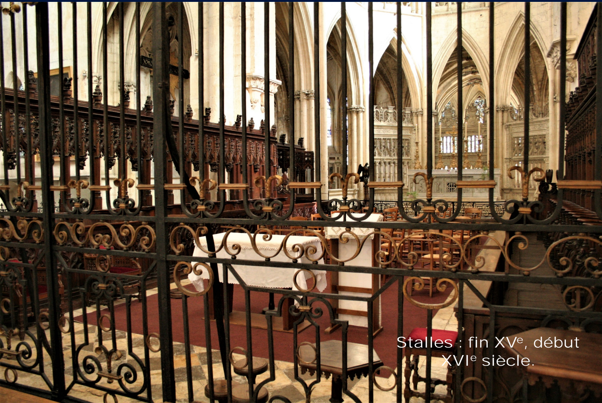
Stalles : fin XV e , début XVI e siècle.