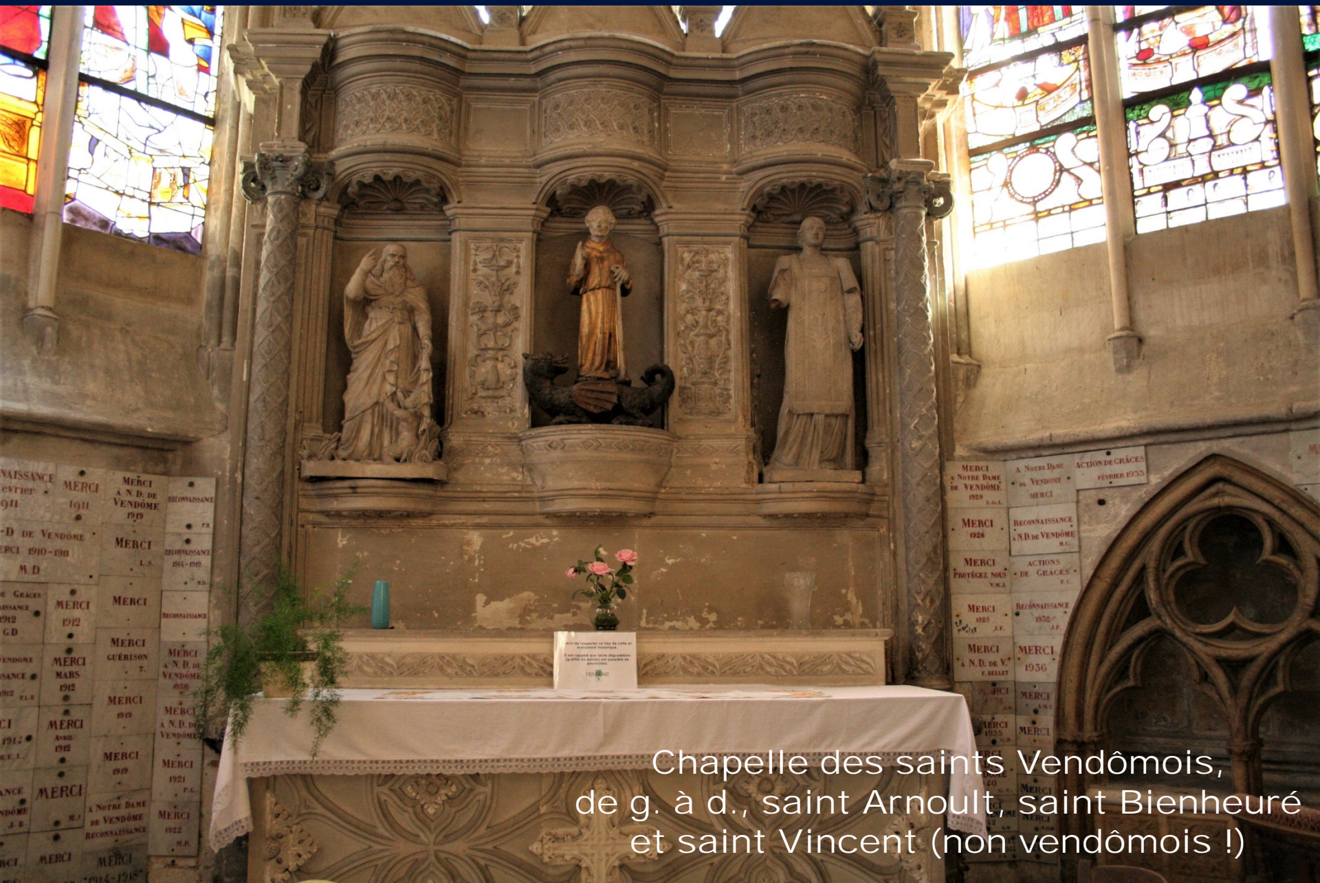
Chapelle des saints Vendômois, de g. à d., saint Arnoult, saint Bienheure et saint Vincent (non vendômois !)