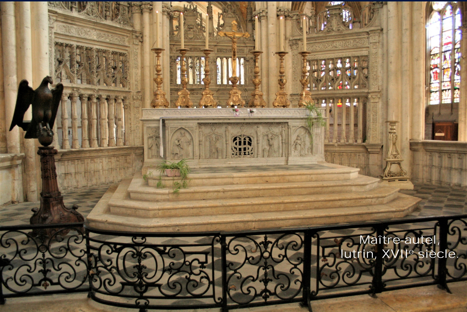
Maître-autel, lutrin, XVII e siècle.