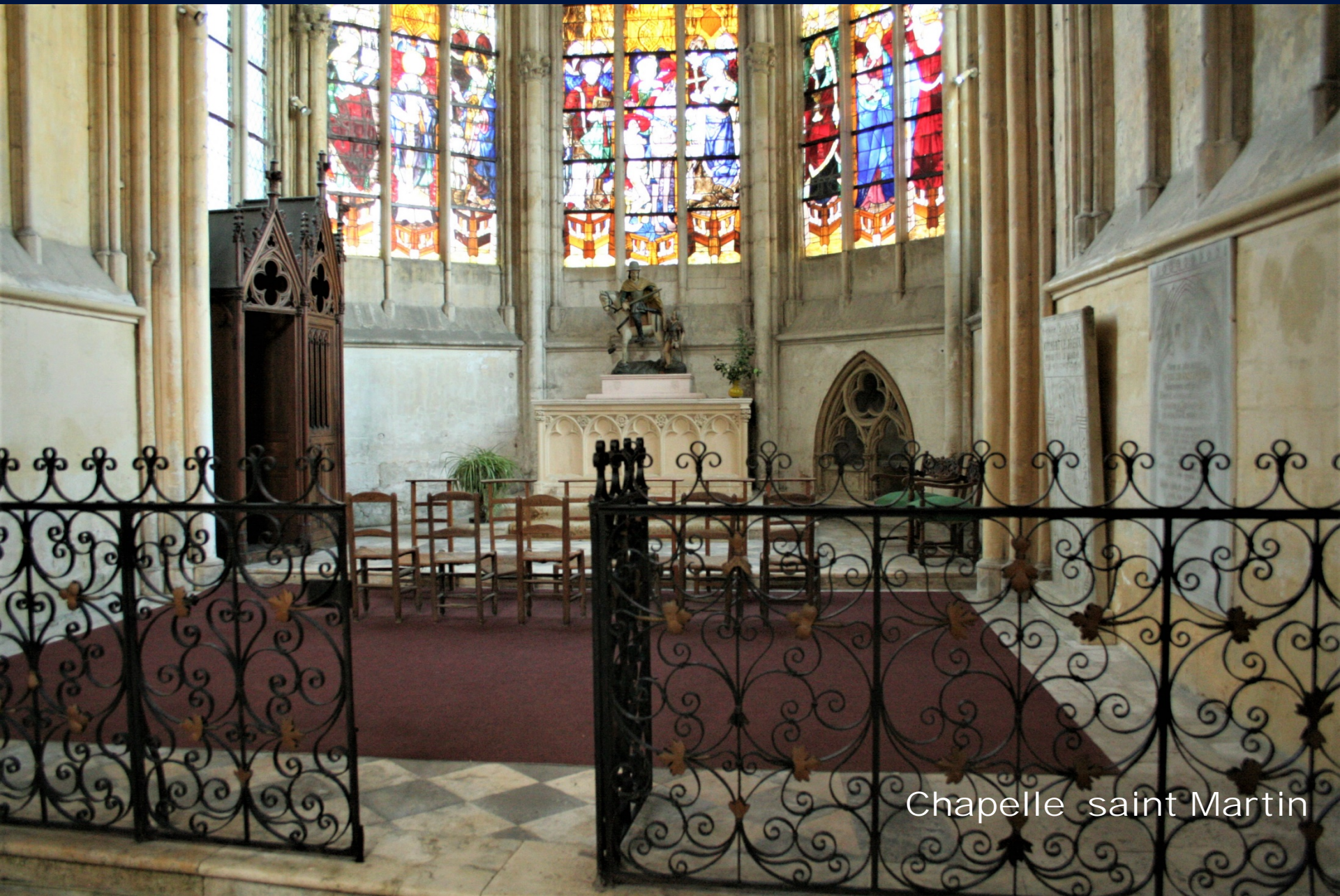
Chapelle saint Martin