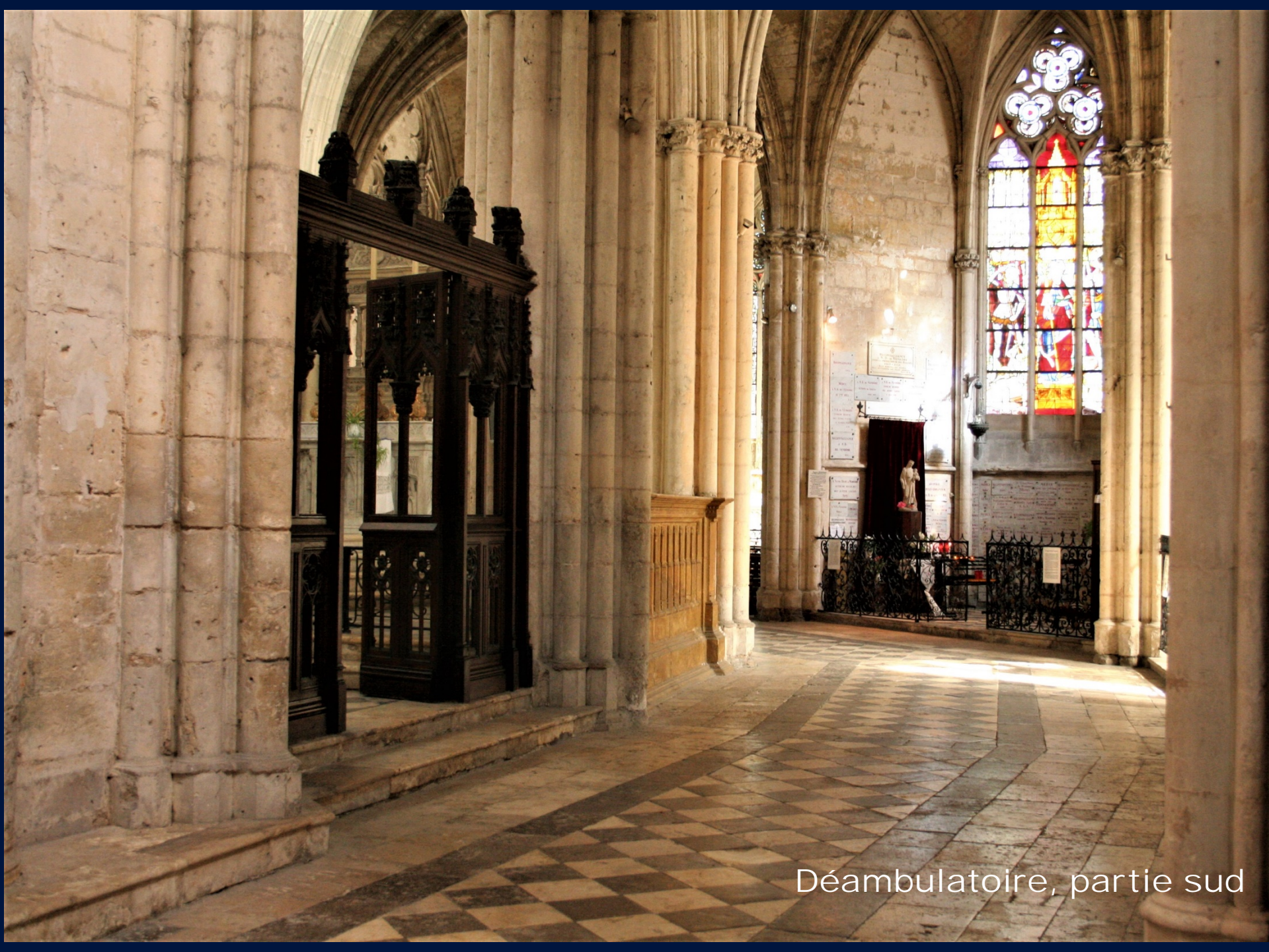
Déambulatoire, partie sud