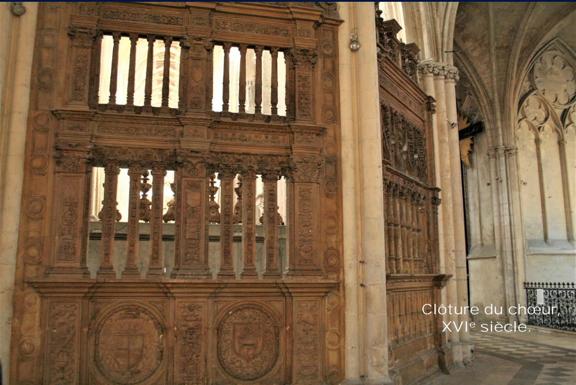
Clôture du chœur, XVI e siècle.