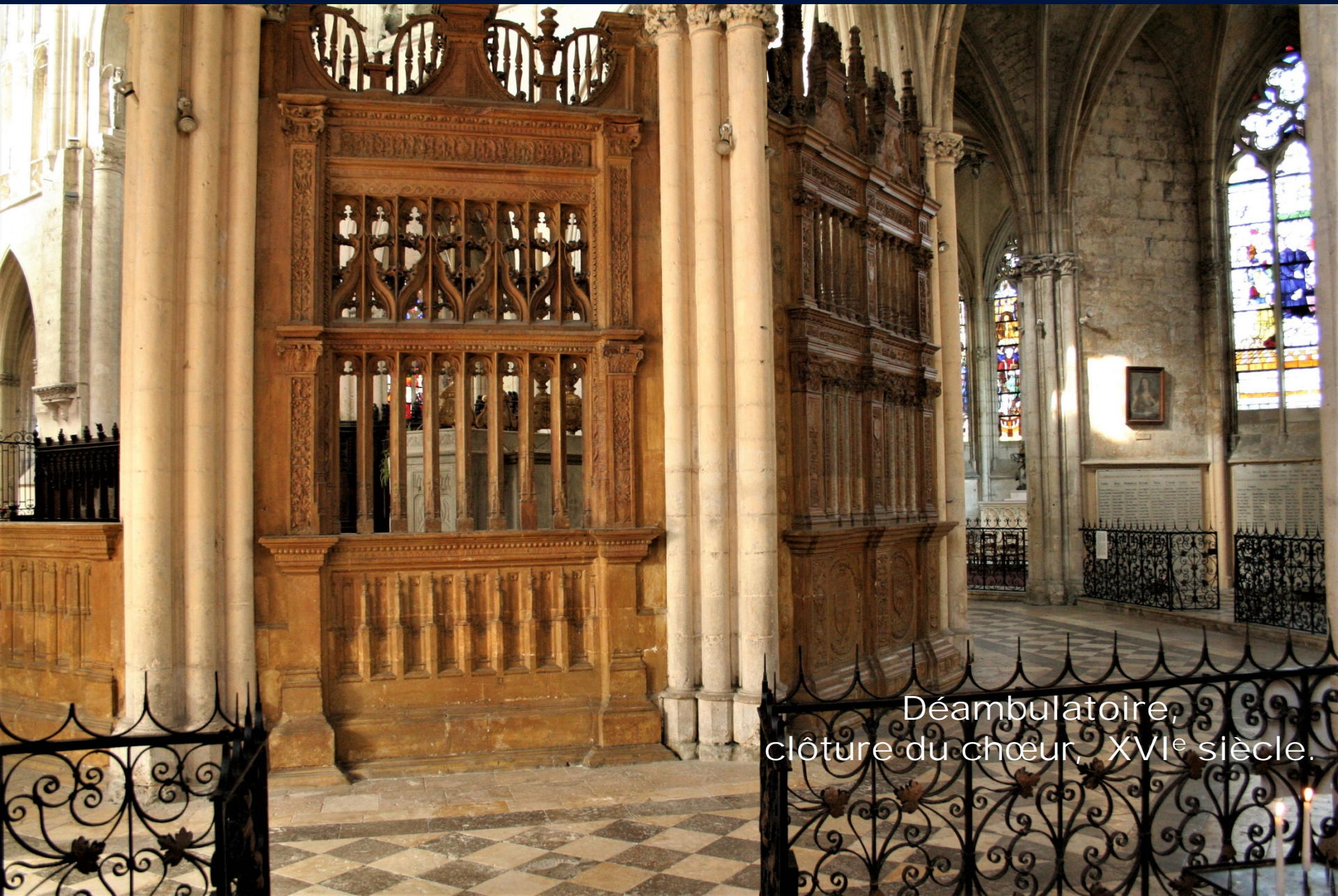
Déambulatoire, clôture du chœur, XVI e siècle.