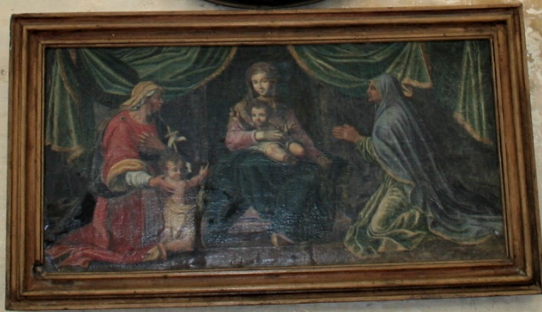
La Vierge à l'Enfant École Française XVII e siècle Musée de la Ville de Paris - Musée de la Ville de Paris Viste de saint Jean et sa famille à la Sainte Famille Musée de la Ville de Paris - Musée de la Ville de Paris