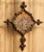
Portail menant à la sacristie, XIX e siècle.