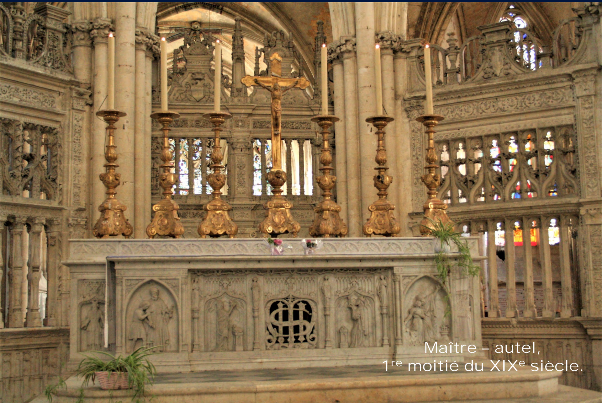
Maître – autel, 1 re moitié du XIX e siècle.