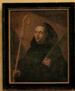
Saint Placide à la sacristie de la cathédrale