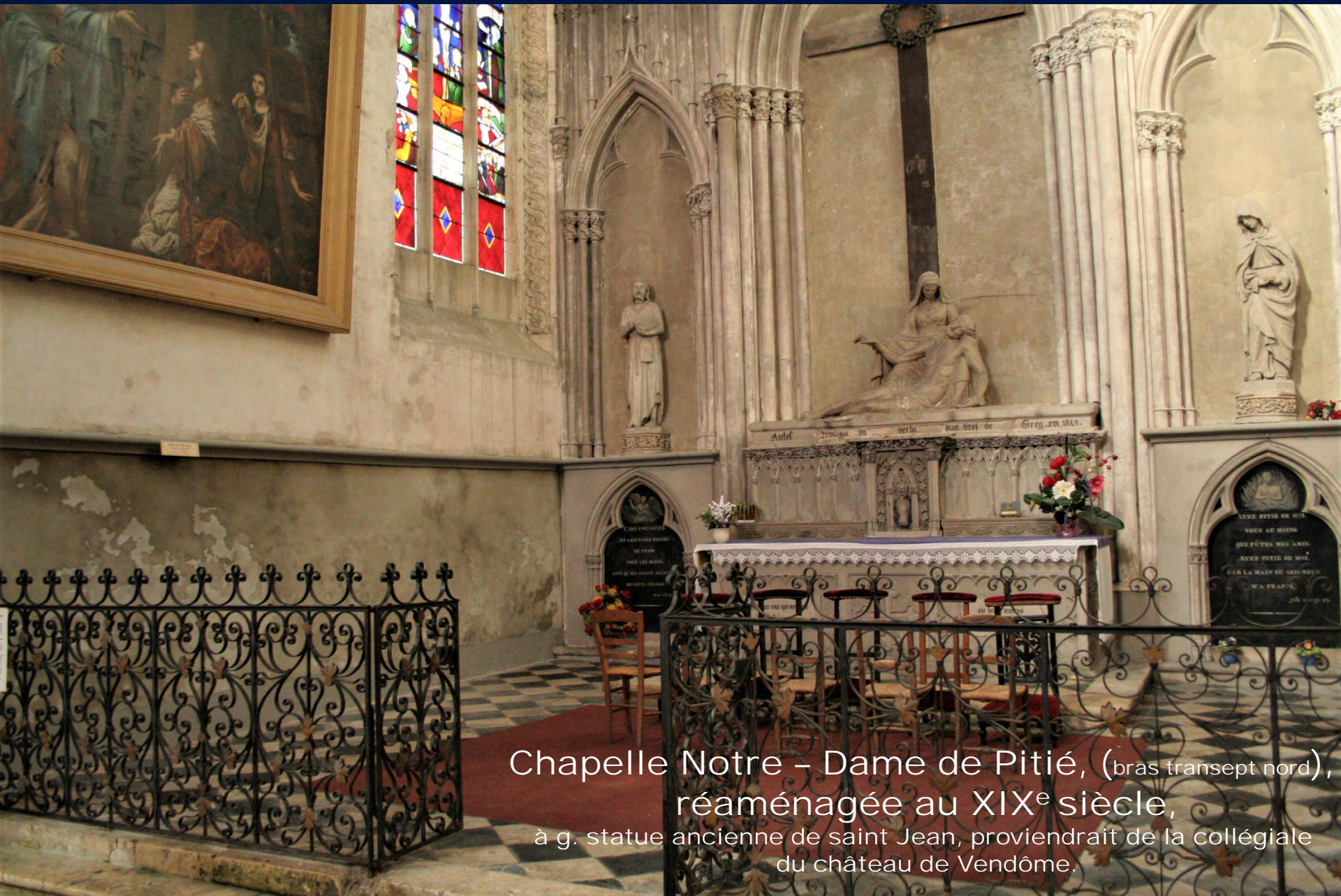
Chapelle Notre – Dame de Pitié, (bras transept nord), réaménagée au XIX e siècle, à g. statue ancienne de saint Jean, proviendrait de la collégiale du château de Vendôme.