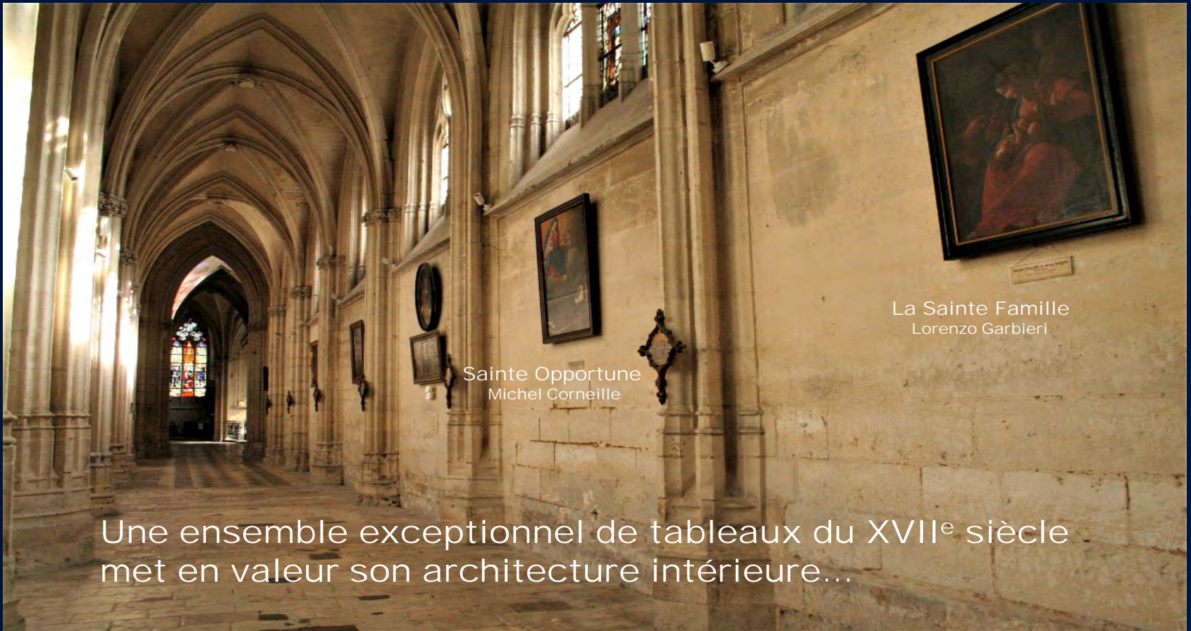
La Sainte Famille Lorenzo Garbieri