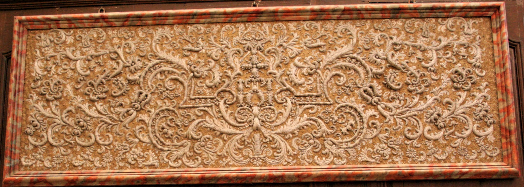
Antependium (devant d'autel), travail vendômois du XVII e siècle.