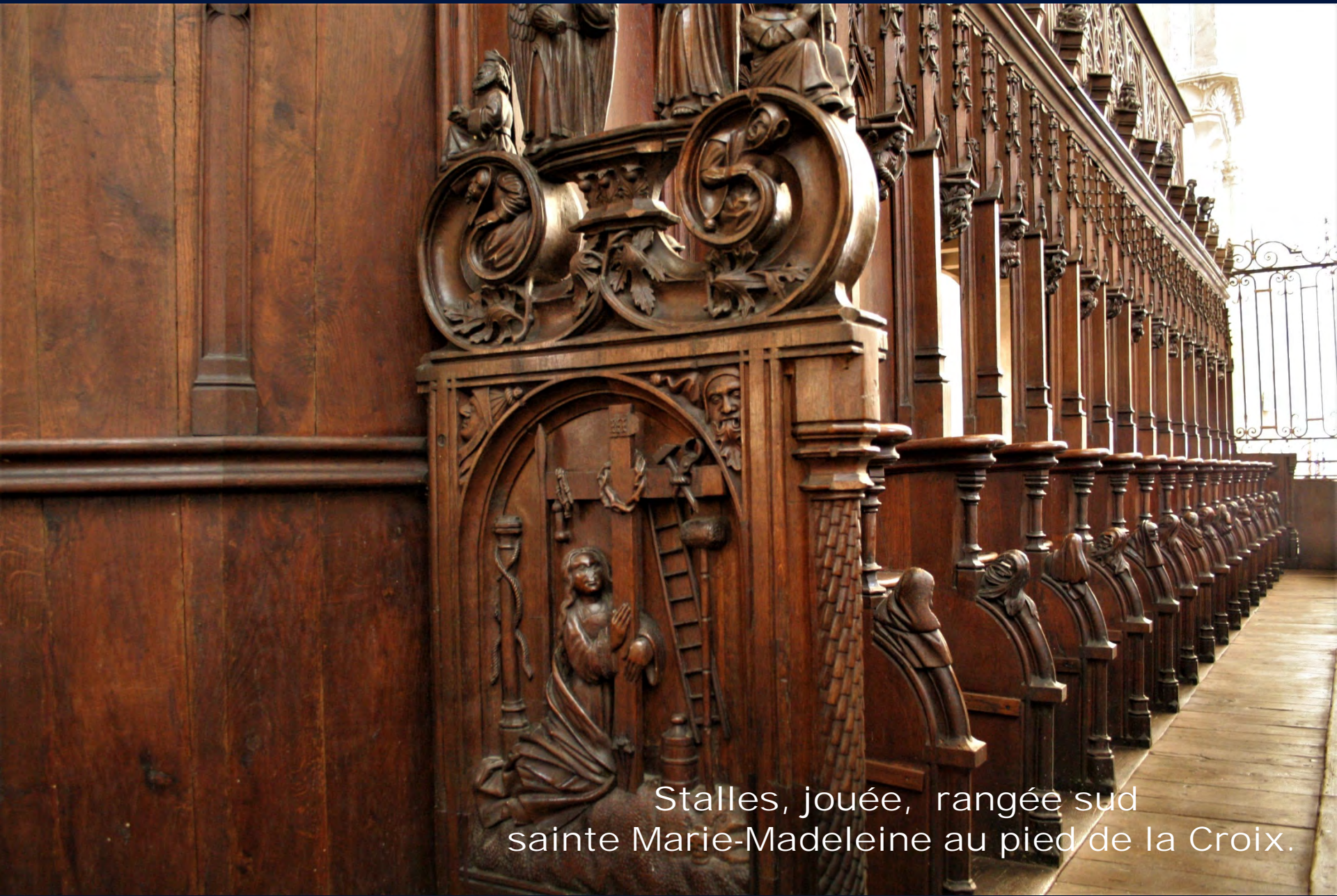
Stalles, jouée, rangée sud sainte Marie-Madeleine au pied de la Croix.