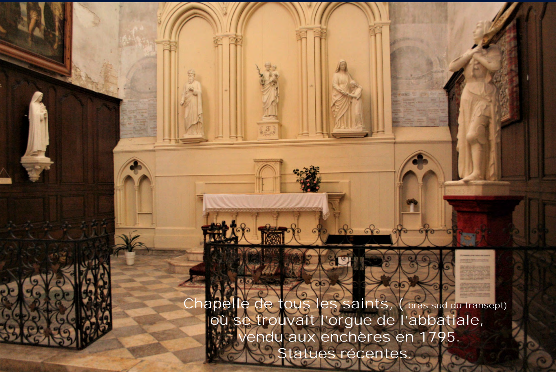
Chapelle de tous les saints, ( bras sud du transept) où se trouvait l'orgue de l'abbatiale, vendu aux enchères en 1795. Statues récentes.