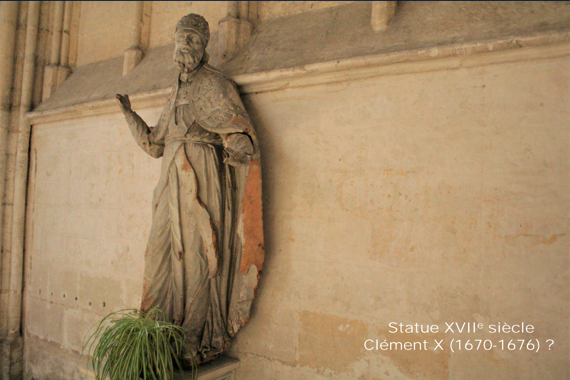
Statue XVII e siècle Clément X (1670-1676) ?