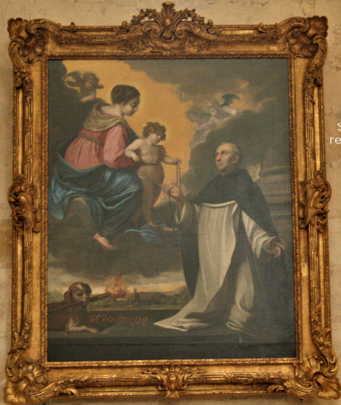
Saint Dominique recevant le Rosaire (Jean Mosnier)