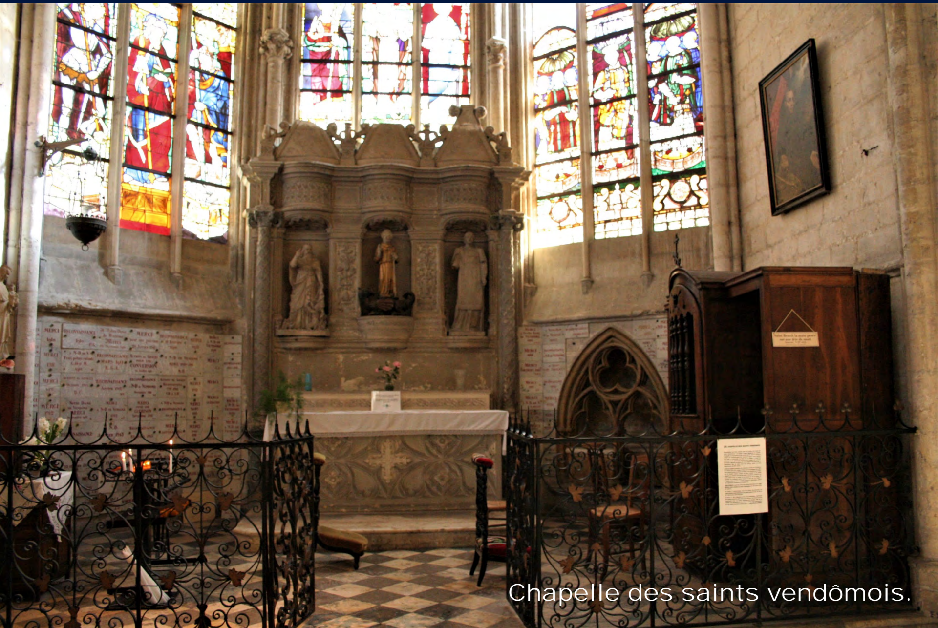
Chapelle des saints vendômois.