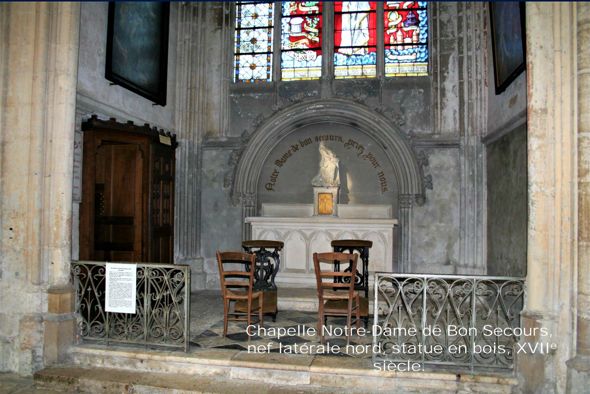
Chapelle Notre-Dame de Bon Secours, nef latérale nord, statue en bois, XVII e siècle.