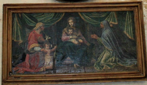
La Vierge à l'Enfant École française XVII e siècle Musée de la Ville de Paris, Paris, France Visite de saint Jean et sa famille à la Sainte Famille Musée de la Ville de Paris, Paris, France