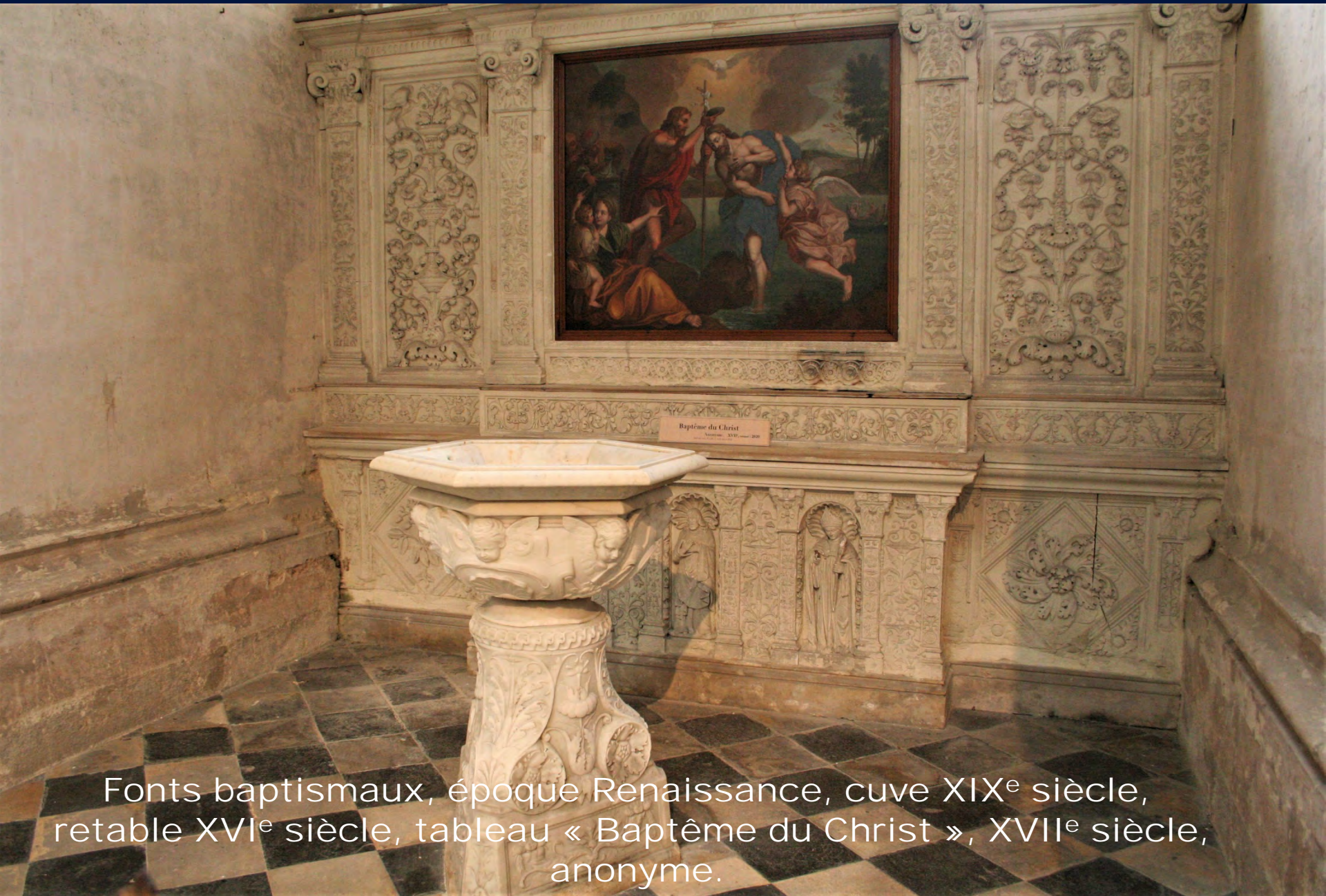
Fonts baptismaux, époque Renaissance, cuve XIX e siècle, retable XVI e siècle, tableau « Bâptême du Christ », XVII e siècle, anonyme.