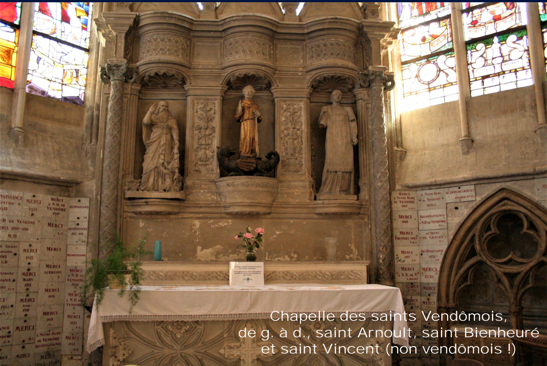
Chapelle des saints Vendômois, de g. à d., saint Arnoult, saint Bienheure et saint Vincent (non vendômois !)