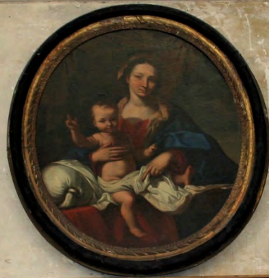
Vierge à l'Enfant (suiveur de Nicolas Mignard)