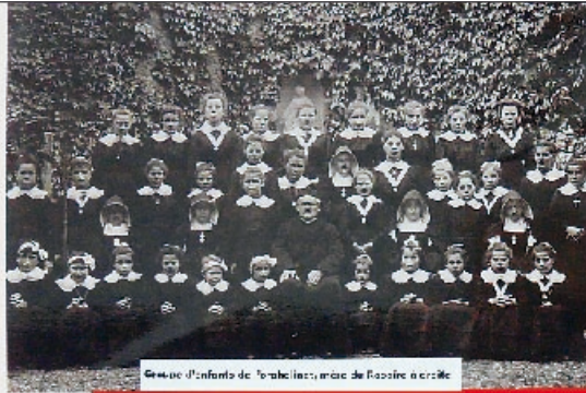
Groupe d'enfants de l'orphelinat de Rosière-aux-Bois