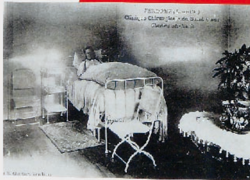
73160 (L.-S.-C.) — Clinique Chirurgicale du Saint-Cœur

Intervention de la clinique de Rosière-aux-Bois, 1914.