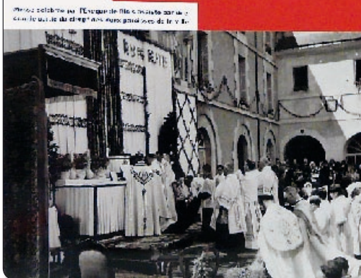
Messe solennelle de la Trinité Marie à la Nativité. Le cardinal de Bourbon est à gauche et le cardinal de Bourbon est à droite.