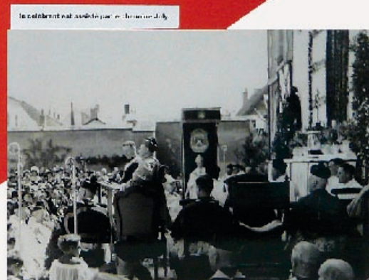
Le cardinal de Bourbon est à gauche et le cardinal de Bourbon est à droite.