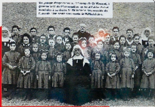
Un groupe d'imprimés en 1911, à Saint-Vincent, à gauche de l'édifice de l'Orphelinat, en haut à droite. Photo prise quelques jours après le décès de M. Bouquet, directeur de l'Orphelinat, qui avait été nommé directeur de l'Orphelinat.