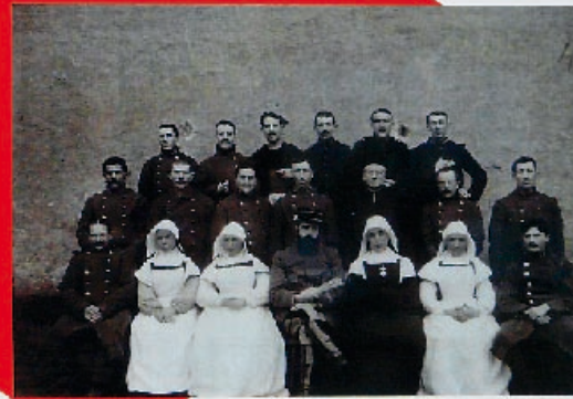
Les religieuses de Vendôme et les militaires en garnison dans la ville de Vendôme. En haut : St Sébastien et St Julien. En bas : St Julien et St Sébastien. Les religieuses de Vendôme et les militaires en garnison dans la ville de Vendôme.