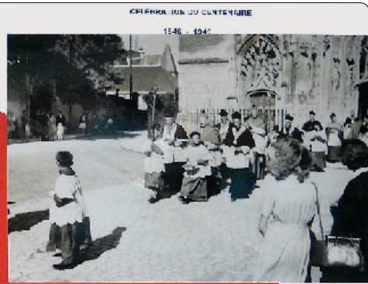
CRÉPHEA TON DU CLINTENORE