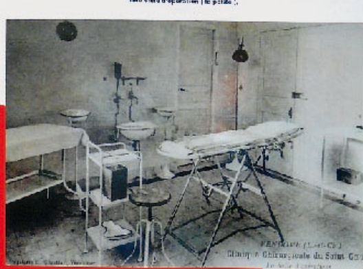
Plan de l'opération (à gauche).

Intervention à l'hôpital de Rosière-aux-Bois grâce au don de l'Association des Femmes de France, 1914.