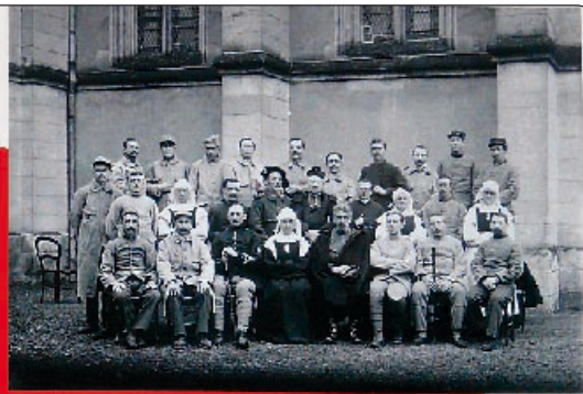
Deux religieuses de Vendôme et un militaire en garnison dans la ville de Vendôme. Les religieuses de Vendôme et les militaires en garnison dans la ville de Vendôme pendant la guerre 1914-18.