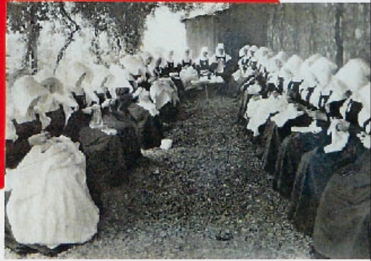
Religieuses en robe blanche, recueillies dans un orphelinat en attendant de pouvoir retourner dans leur pays natal. Elles sont ici en attendant de partir en 1914.