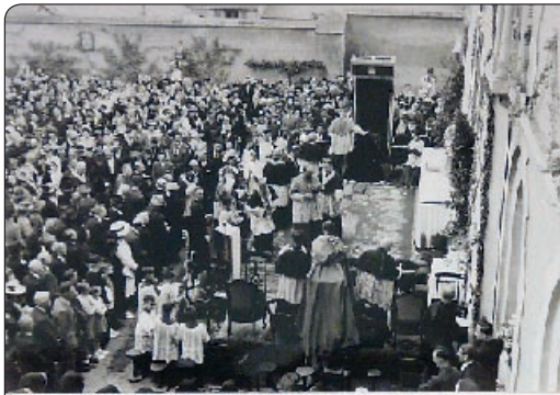
Le cardinal de Bourbon (Charles de Bourbon) et ses assistants de la messe solennelle de la Trinité Marie à la Nativité. Le cardinal de Bourbon est à gauche et le cardinal de Bourbon est à droite.