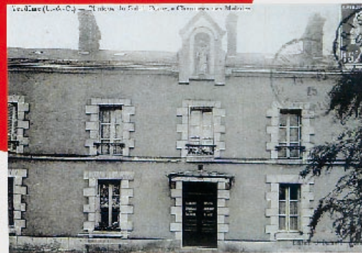
73160 (L.-S.-C.) — Clinique Chirurgicale du Saint-Cœur