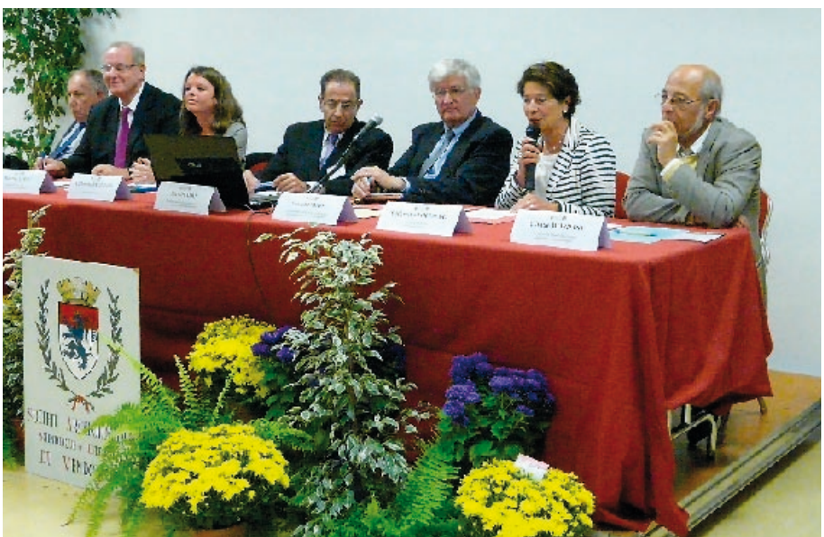
L'inauguration du colloque.