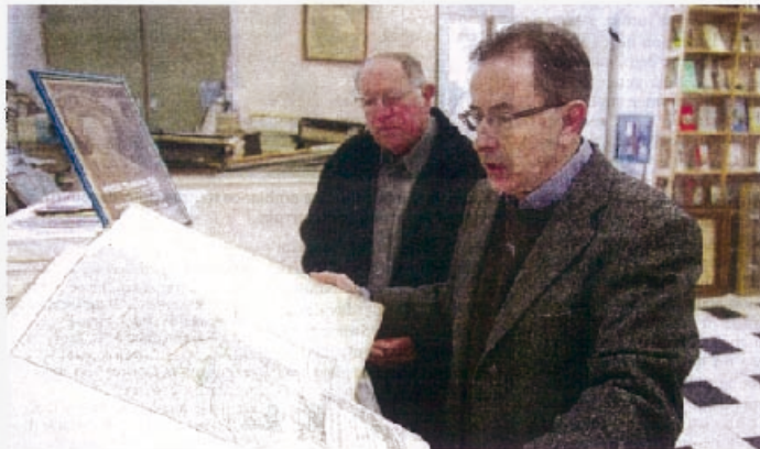
Dernière trouvaille en date de la Société dans ses ouvrages récemment répertoriés : un atlas géographique du XVII e siècle.