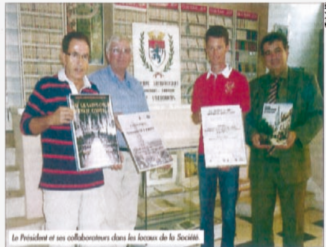
Le Président et ses collaborateurs dans les locaux de la Société.

Centré sur une réflexion sur le passé et l'avenir des sociétés savantes locales, le colloque débutera samedi 22 septembre par des conférences où seront évoqués les figures de quelques grands personnages de la Société Archéologique. Seront ensuite abordés les thèmes tels que le rôle joué par la société dans les recherches géologiques et archéologiques locales, et son action dans le domaine de la conservation, avec l'exemple de la reconstitution d'une collection exceptionnelle de pièces de monnaie vendômoises, de la