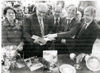
Nombre d'élus présents vendredi soir lors de l'assemblée générale où des objets du legs Bellande étaient sortis des réserves.