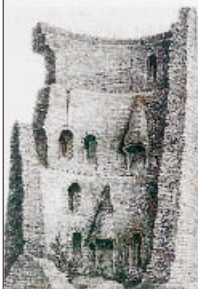
Le donjon féodal, dessiné par Gervais Launay.