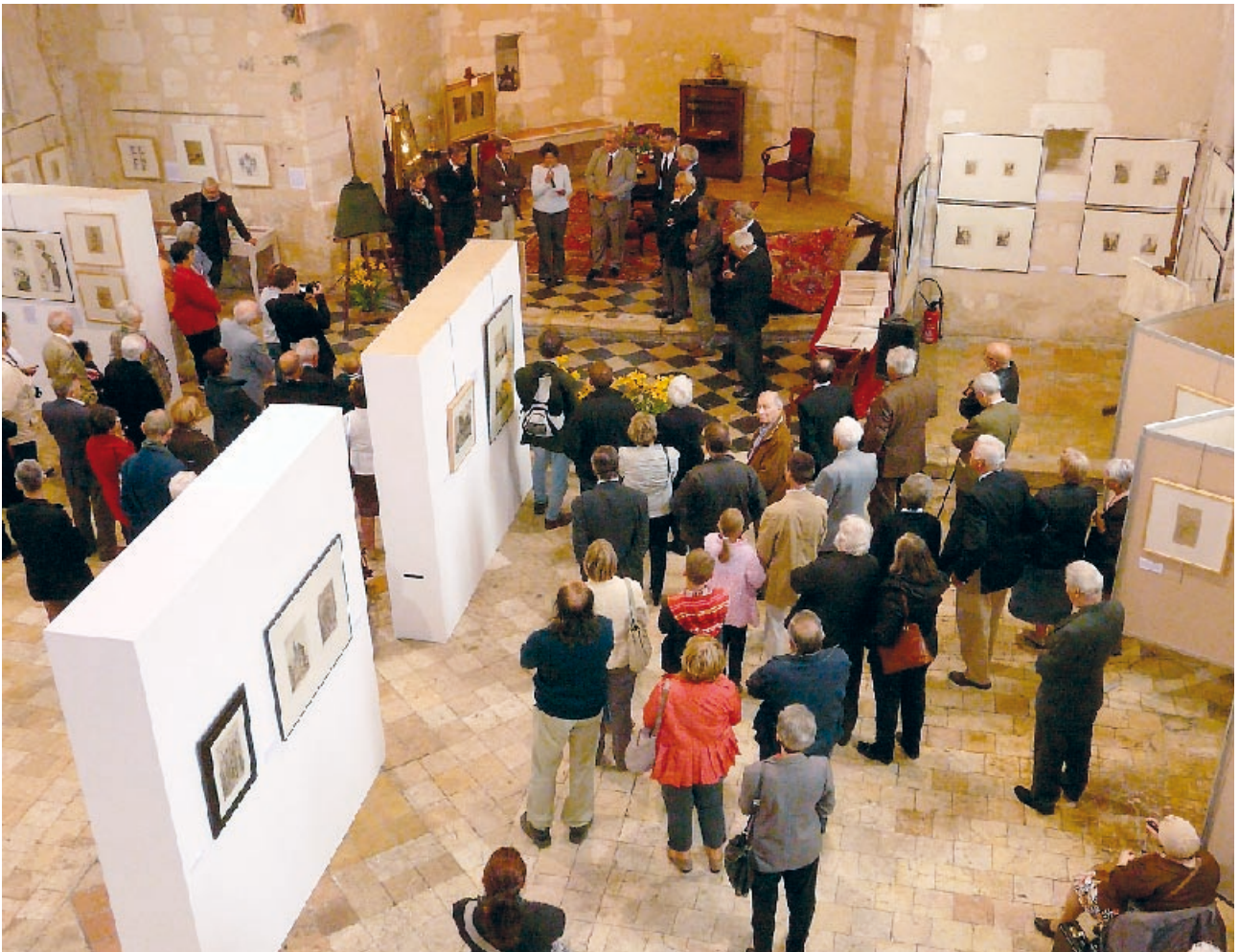
Du vendredi 14 au dimanche 23 septembre : l'exposition Queyroy.