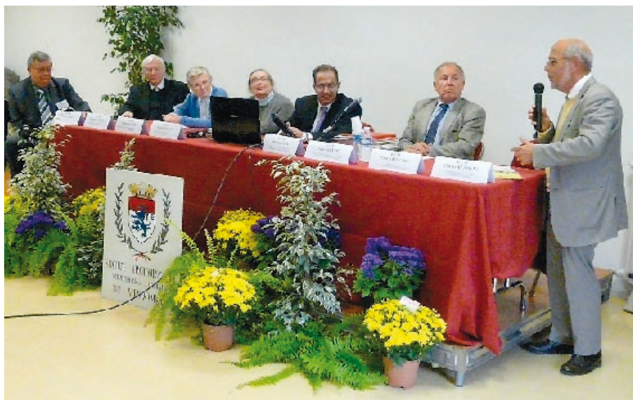
Forum des Sociétés savantes.