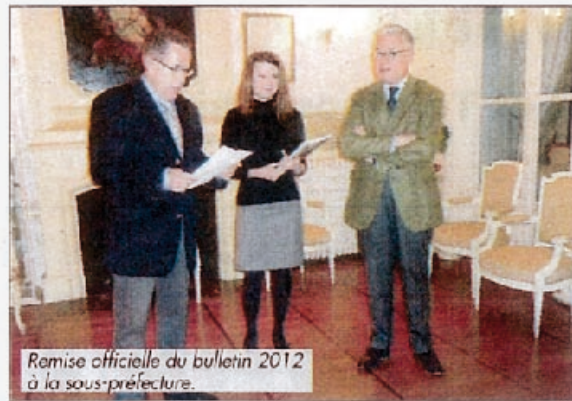
Remise officielle du bulletin 2012 à la sous-préfecture.

L'ambiance était conviviale à la sous-préfecture pour la présentation du dernier bulletin de la Société Archéologique.