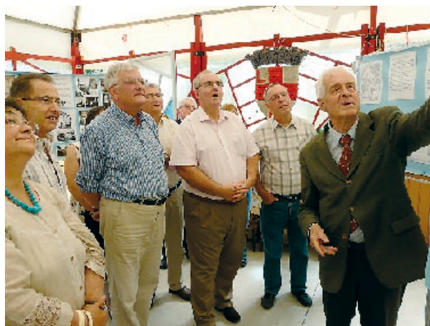
Samedi 21 juillet 2012, exposition à Lisle.