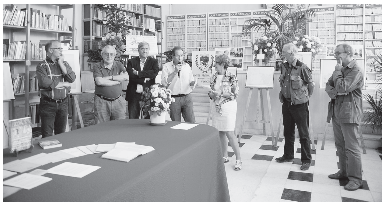
Présentation de l'exposition

Exposition Quartier Rochambeau, à la Société archéologique samedi et dimanche de 14 h à 18 h ainsi que mercredi 19 septembre et vendredi 21 septembre de 14 h à 17 heures.