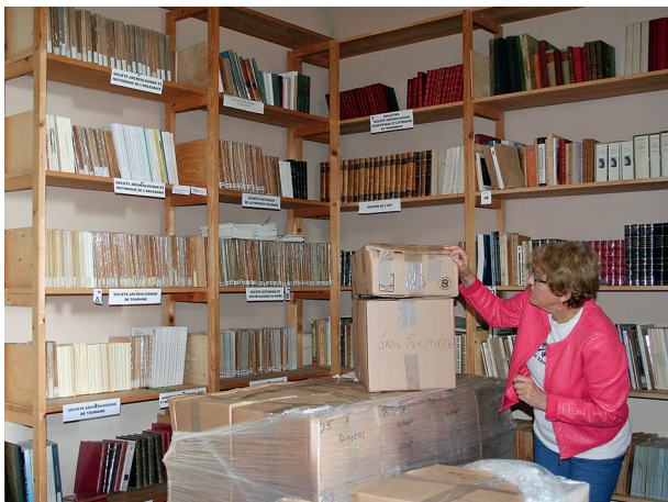
Installation à l'Hôtel du Saillant