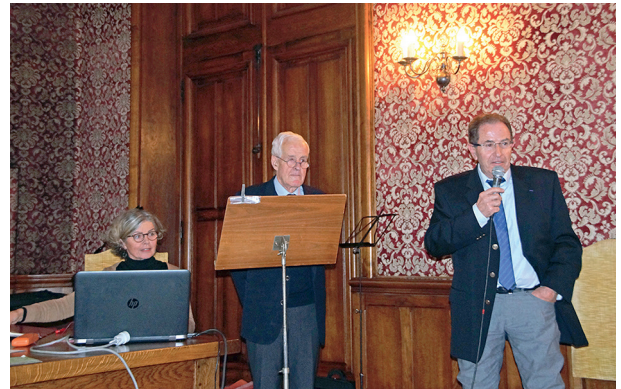
Remerciements du président

La première partie, conformément aux statuts, a été réservée aux actes statutaires de la Société. Le rapport moral fut présenté sous forme d'un diaporama bien documenté par Pierre Morali, secrétaire, reprenant les différents temps forts qui ont marqué la vie de « vieille dame du Vendômois » depuis le mois de juin dernier. Malgré un deuxième déménagement qui a mené notre Société du bâtiment Régence à l'hôtel du Saillant, le conseil d'administration a fait le choix de maintenir l'ensemble de nos activités, évitant ainsi une rupture qui aurait été préjudiciable à ces dernières. Après la présentation du montage, le rapport d'activité a été voté à l'unanimité moins une voix contre.