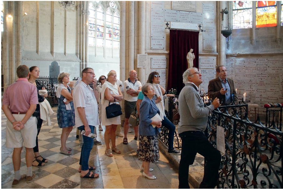
Visite des tableaux de la Trinité

tableaux de l'abbatiale et faisait suite aux travaux menés l'année précédente sur cet ensemble méconnu de l'abbatiale et dont deux toiles vont être restaurées cette année. La seconde était réservée à la présentation des stalles, véritable petit trésor et témoin des derniers grands travaux d'embellissement de l'abbatiale réalisés entre la fin du XV e et le début du XVI e siècle.