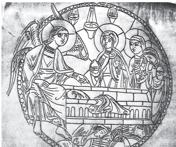
Un exemple de la précision des relevés exécutés à partir des calques.