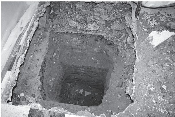
Un des sondages

tonnes de gravats ont-elles été extraites et on peut facilement imaginer les soucis. La Ville, à ce niveau, nous a apporté un gros soutien logistique, en protégeant par d'immenses bâches plastiques les livres placés sur étagères et le mobilier présent. Elle a assuré ensuite une remise en état des lieux afin d'assurer au mieux l'exposition prévue pour les Journées européennes du Patrimoine. Nous l'en remercions bien vivement.