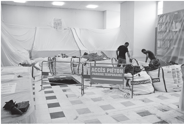
Protection des collections

De tels travaux créent beaucoup de désagréments essentiellement liés à la poussière. Ainsi, plus de dix