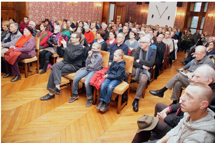
Un public nombreux