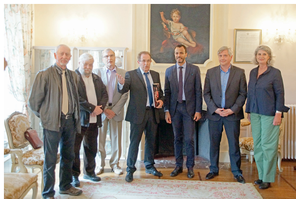
Un sous-préfet bien entouré