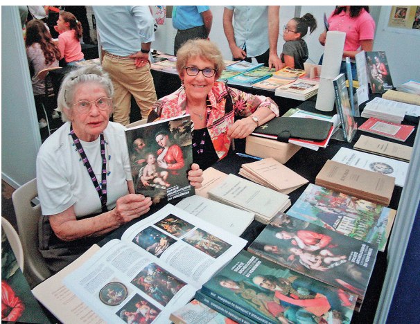
Le stand de la Société