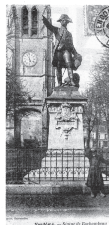
La statue d'abord placée plus près de la tour Saint-Martin.

Apparemment, pas si simple de trouver le site adéquat pour la statue de Rochambeau, réalisée par Fernand Hamar, posée sur le piédestal de l'architecte Boué, qui fut inaugurée en grande pompe le 4 juin 1900 plus près qu'aujourd'hui de la tour. En janvier 1942, l'occupant allemand faisait récupérer la statue pour la faire fondre. Quelques jours seulement après la libération de Vendôme, un buste de plâtre du maréchal venait occuper le piédestal. Il faudra attendre 1974 et la générosité de la Société des Cincinnati pour qu'un nouvel exemplaire soit réalisé à partir d'un moulage clandestin et de nouveau inauguré le 5 juin.