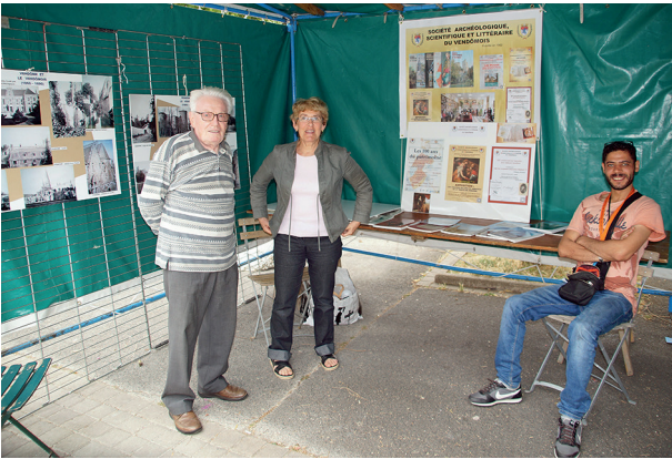
18-19 juillet : présentation de l'association.

Dans le cadre de l'opération « Quartier d'été », initiée par le service d'animation de la Ville de Vendôme, nous nous sommes retrouvés pour deux après-midi au quartier des Rottes pour présenter à la population ce qu'était une association s'occupant de patrimoine et d'histoire. Après des débuts un peu timides, les jeunes du quartier n'hésitèrent pas avec leurs animateurs, à rejoindre notre stand pour le découvrir et discuter avec nous.