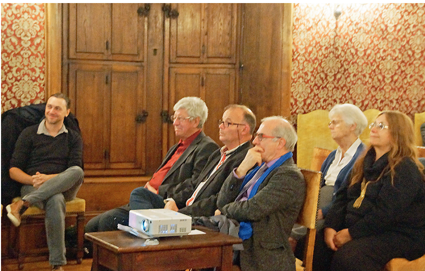
Le 17 novembre lors de la 395 e Assemblée générale.