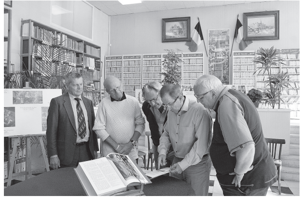
Les 21 septembre, la délégation danoise accueillie dans les locaux de la Société.

sensibilisation plus grande du public à cet ensemble exceptionnel que possède l'église abbatiale de la Trinité. La journée se termina par une présentation des stalles de la Trinité, également assurée par Bernard Diry, devant un groupe particulièrement intéressé par le sujet.