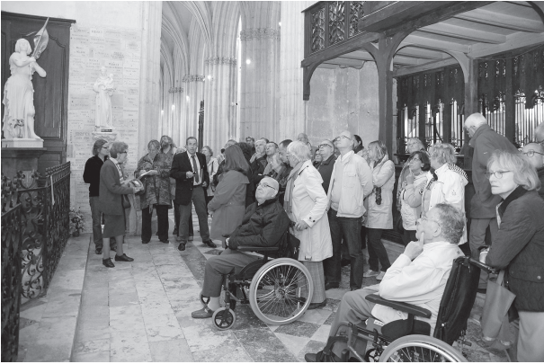
Les 16 et 17 septembre, à la découverte des tableaux de la Trinité.