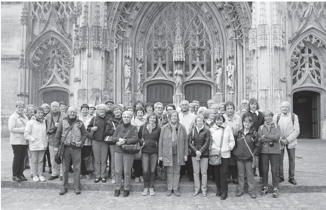
Le 27 septembre, visite de Vendôme.