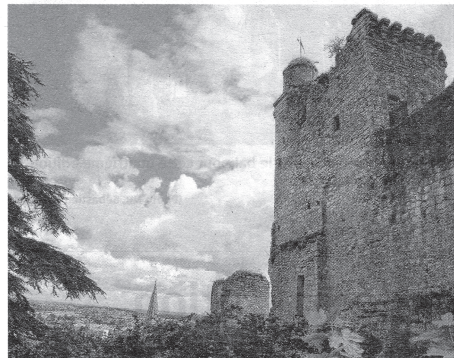
Quel avenir pour les remparts du château dont la tour de Poitiers qui surplombe la ville ?