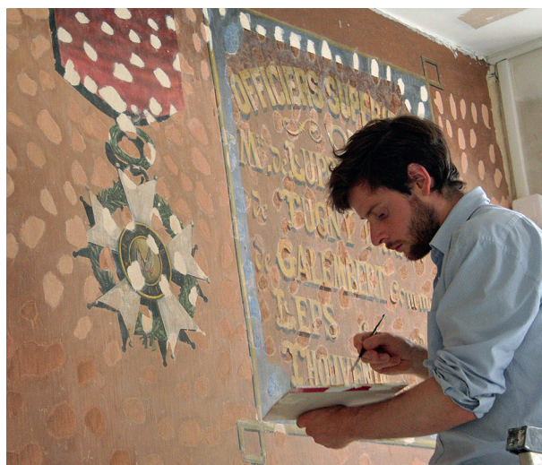
La restauration de peintures murales dans une salle de l'ancienne caserne le 12 juillet 2017.

À l'invitation de la Ville de Vendôme nous avons pu découvrir le chantier de restauration de peintures murales datant du début du XX e siècle et ayant trait à l'histoire du régiment du 20 e Chasseurs. Réalisées dans une salle d'instruction de l'ancienne caserne, leur restauration s'avère particulièrement délicate en raison de gros dommages qui leur furent infligés lorsqu'on décida, pour des raisons indéterminées, de les faire disparaître sous une épaisse couche d'enduit.