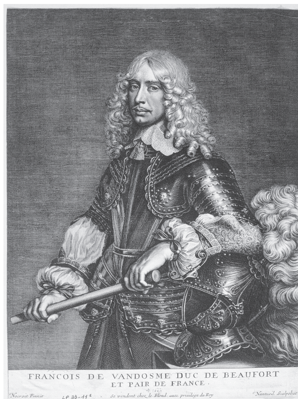
Fig. 3 : François de Vendôme jeune.

quée de douves auxquelles succédait la cour intérieure du château, elle-même entourée d'une enceinte de bonne hauteur, également bordée de douves. S'enfuir du donjon était à peu près inimaginable. C'est pourtant ce que tenta et réussit Beaufort, en mai 1648, avec l'aide de complices qui l'attendaient à l'extérieur, dans des conditions rocambolesques dignes d'un roman de cape et d'épée. Il s'échappa et vécut quelque temps dans la clandestinité, peut-être en Vendômois 16 .