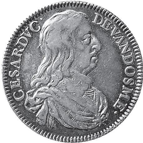
Fig. 4 : Jeton représentant César de Vendôme surintendant de la navigation (1658).

Beaufort de reparaître à la cour et pour le duc de Vendôme de rentrer d'exil d'Italie 17 .