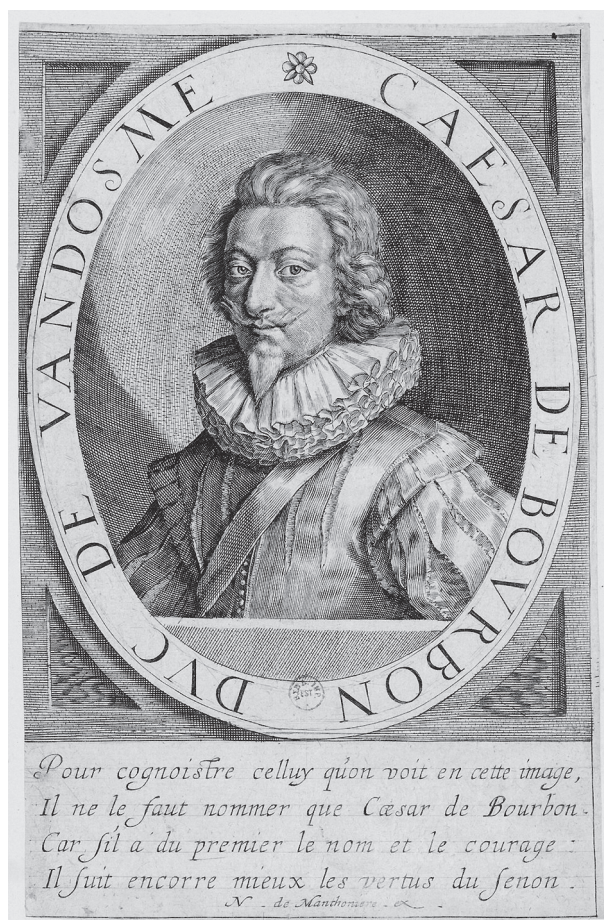
Fig. 1 : César de Vendôme vers l'âge de trente ans environ 3 .

mère de ses enfants bâtards et rendre ainsi César apte lui succéder. Pour cela, il fallait faire de César un parti présentable, c'est-à-dire lui attribuer un titre de dignité et un nom à la hauteur de l'enjeu, le pourvoir d'une haute charge dans le royaume et lui trouver pour femme une riche héritière. Le ralliement du duc de Mercœur, dernier ligueur encore en lice, allait lui fournir l'occasion d'atteindre tous ces objectifs. Le 3 avril 1598, le roi fit don à César du duché et du nom de Vendôme, qui avaient appartenu à ses ancêtres Bourbon, manière de l'inscrire dans leur lignée malgré sa bâtardise 4 . Le 5 avril, il imposa au duc de Mercœur un contrat de mariage entre César et Françoise, fille unique du duc. Ce même contrat prévoyait la renonciation de Mercœur au gouvernement de Bretagne, qu'il tenait du roi Henri III, son beau-frère, et sa dévolution à César. Le nouveau gouverneur, trop jeune pour exercer ses fonctions (il avait quatre ans), fut secondé jusqu'à sa majorité par deux lieutenants généraux, les ducs de Montbazou et de Brissac.