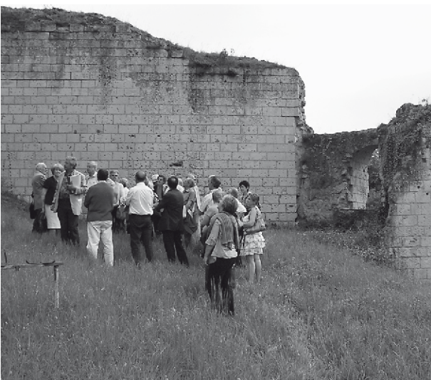
Sortie de printemps dans la vallée du Loir...