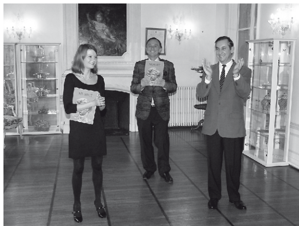
Présentation du bulletin.