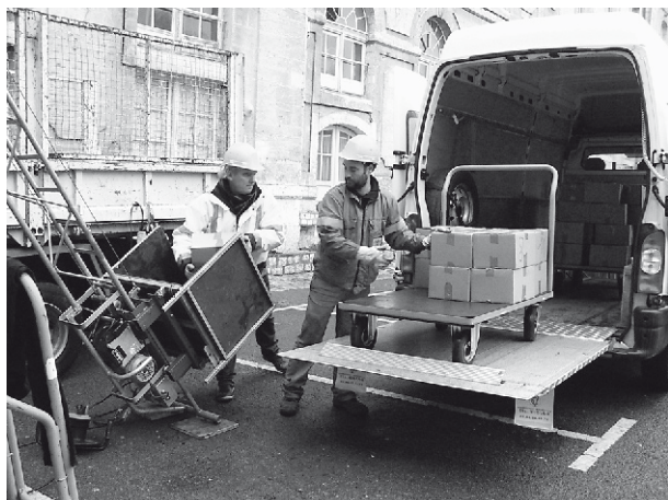
Déménagement des livres de la Société Archéologique.

Déménagement des livres de la Société Archéologique