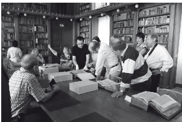
La Société Royale d'Archéologie de Charleroi en Vendômois.

accueilli le groupe en leur demeure, l'Hôtel Marescot, avant d'offrir un apéritif dans leur jardin.