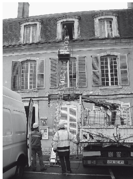
Déménagement des livres de la Société Archéologique.