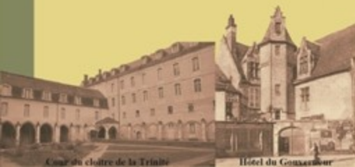
Cour du cloître de la Trinité